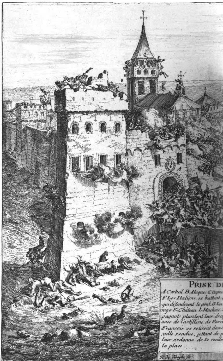
PRISE DE A Corbeil. B. Atagues. C. Capres. F. Les Italiens se battent qui défendoient le pont. G. La muga. K. Chateau. L. Machine. Espagnols plantent leur drapeau avec de l'artillerie de Paris. Francois se retirent dans ville rendue, jettant de leur ordonne de se rendre la place. 1545. D. B. de la Roche.