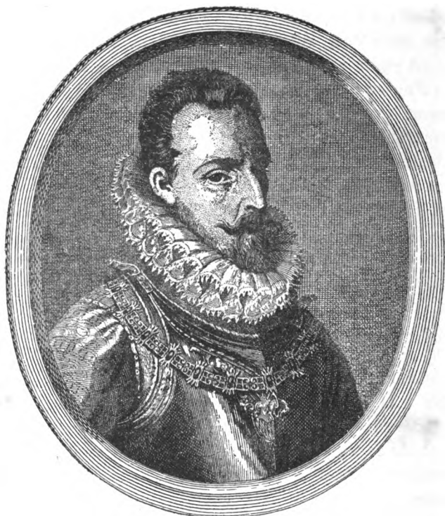
PORTRAIT D'ALEXANDRE FARNÈSE.