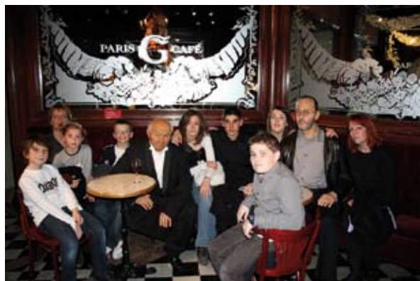
Le GDS au Musée Grévin.

Qui dit nouvelle année, dit «NOUVEAU SPECTACLE». En effet, vous pouvez d'ores et déjà noter sur vos agendas, VENDREDI 29 AVRIL 2011. Durant cette soirée, vous pourrez revivre l'ambiance festive des années 80, et redécouvrir les «tubes» qui vous ont fait danser. Réservations à partir du 15 Mars 2011. A bientôt... «dans un univers de paillettes» !