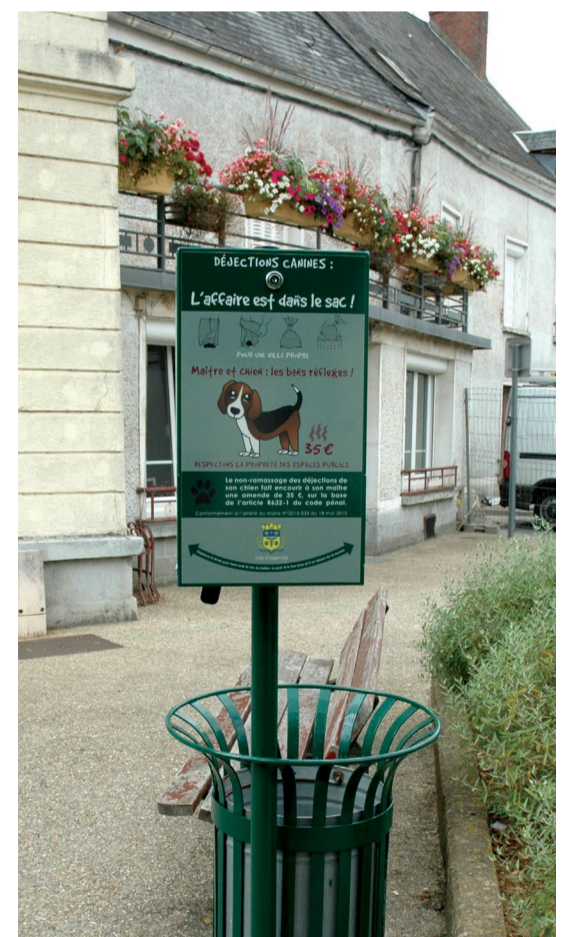
À la suite de demandes formulées lors des rencontres, 10 dispositifs canins ont été déployés en test sur la ville, en juin dernier.

En plus de s'y tenir informées, ces instances d'échanges permettent aux habitants de participer à la vie de la commune et d'être force de proposition. « Pourriez-vous étudier la possibilité de ramasser les objets encombrants pour les personnes âgées qui peinent à se rendre à la déchèterie ? » demandait une habitante à l'occasion de l'édition de l'été. C'est maintenant chose faite ! La Ville vient de mettre en place le service « Allô encombrants » pour les personnes âgées de plus de 65 ans (lire page 4).