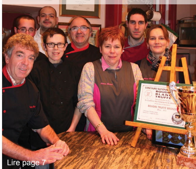
Lire page 7