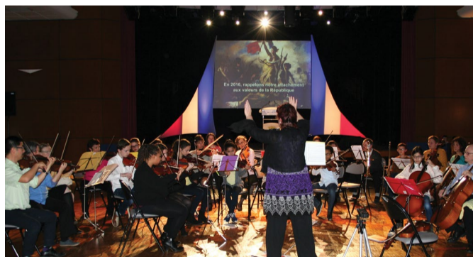
Intervention du Conservatoire intercommunal de Musique

2016 est donc bien l'année des choix, celle où l'ensemble des élus auront, en connaissance de cause, à prendre des décisions qui engageront la collectivité pour les prochaines années. C'est le message que le Maire souhaitait porter à la connaissance de la population à l'occasion de cette cérémonie qui constitue un moment de dialogue et d'échange très important pour les habitants.