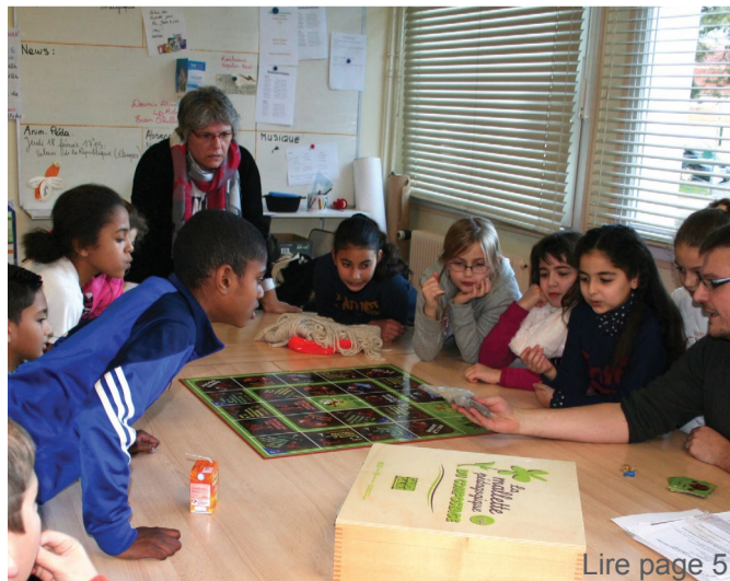
Lire page 5