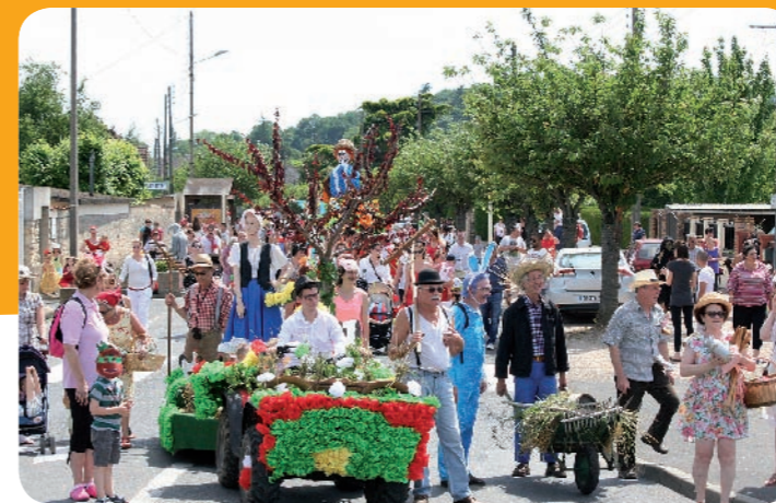
Le char de CUBE et de MTA

L' édition 2015 du carnaval de Ballancourt a fait la part belle aux fables et contes de notre enfance. A l'initiative du Comité des fêtes, plusieurs associations se sont mobilisées pour animer le défilé en ce beau dimanche du 7 juin : le Bal en Cours, le Cube, Le Jambalaya club danse, le Rando'Ball, le Rugby Club, le Tai Jitsu, les Rollers.