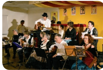
La troupe de CUBE au grand complet

quelques chansons émouvantes des hommages ont été rendus à Edith Piaf, dont c'est le centenaire de la naissance cette année, ainsi qu'à Jean Ferrat, disparu il y a juste cinq ans. 🎵