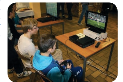
Tournoi « Fifa »