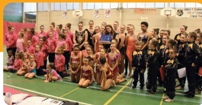
Les différentes équipes lors du critérium de Ballancourt

Lors de son critérium de juin, au gymnase Pierre Denize, le Club a accueilli 15 groupes de régions différentes et 160 athlètes ont concouru ce jour-là pour tenter de remporter le «Challenge Daniel Salvi», celui-ci a été remporté par le Club de GONESSE (95) qui reviendra le remettre en jeu la saison prochaine. 🍴