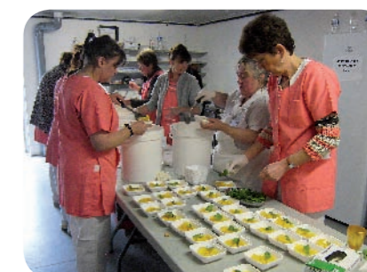
Le personnel du restaurant scolaire à l'oeuvre