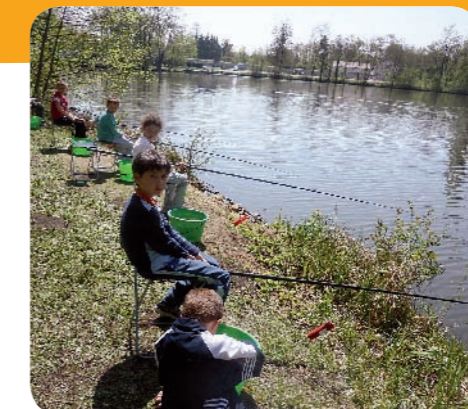
Le cours pratique

Mardi 21 avril une journée initiation à la pêche a été organisée par l'accueil de loisirs de Ballancourt à l'étang des hirondelles. Les enfants ont été encadrés par les animateurs de la « Fédération Départementale pêche 91 ».