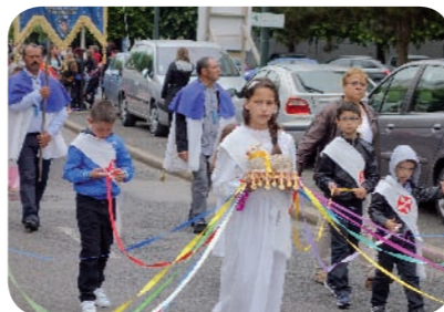
Beaucoup de ferveur même pour les plus jeunes

D imanche 31 mai, la communauté portugaise a fêté Notre-Dame de Fatima. Après la messe célébrée en l'église de Saint-Martin de Ballancourt, l'Immaculée Conception, la statue de Notre Dame de Fatima a été portée en procession par les hommes dans les rues de Ballancourt. 🎉