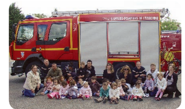
« Les enfants et quelques parents accompagnateurs de la halte-garderie « La Poussinette » ont été accueillis par les pompiers et par l'équipe du poney-club de Ballancourt. Qu'ils soient remerciés pour leur sympathique accueil. »