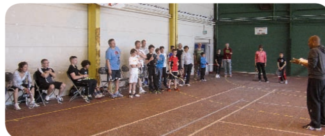
Mise au point avant la compétition