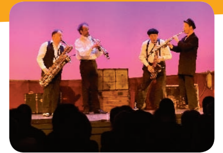
Un quatuor de saxophonistes plein d'humour

C'est devant une salle comble que « les DeSAXés », un quatuor de saxophonistes, nous ont présenté un spectacle musical et humoristique de très grande qualité. Une prouesse musicale que les spectateurs, grands et petits, ne sont pas prêts d'oublier. 🎷