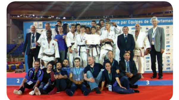
L'équipe de l'Essonne masculine, championne de France Minimes par équipes

L'AJB est fière de compter 2 champions de France Minimes. Bravo à nos judokas! 🍴