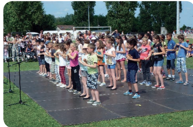
Evolution des écoliers de Saint-Martin