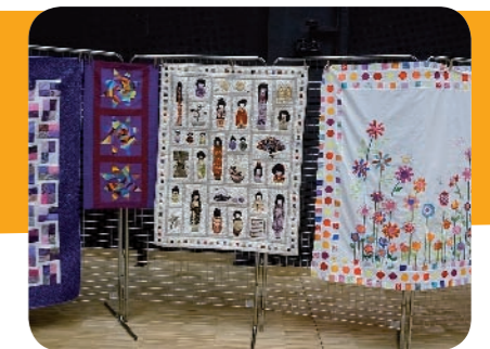
Des panneaux collectifs très réussis

Une Journée de l'amitié, c'est un moment d'échanges d'expériences, de méthodes, de conseils, mais aussi l'occasion de réaliser 6 panneaux collectifs qui sont tirés au sort en fin de journée et attribués à 6 heureuses gagnantes. C'est donc un agréable moment de partage dans la bonne humeur et la convivialité.