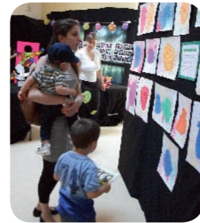
Une visite passionnante