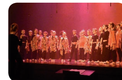
Le chœur de l'école Saint-Martin