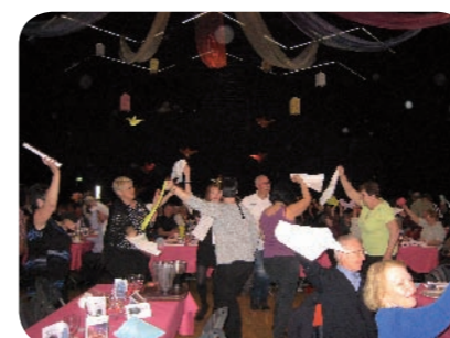
Faire tourner les serviettes