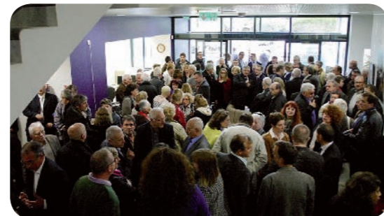
La foule se presse dans le hall d'accueil

Samedi 11 avril dernier s'est tenue l'inauguration de la Maison des Services Publics, siège de la Communauté de Communes du Val d'Essonne. L'occasion pour les habitants de Ballancourt et du Val d'Essonne de découvrir ce bâtiment mais aussi de venir rencontrer les élus et agents de la CCVE durant la matinée « portes ouvertes » organisée à leur intention.