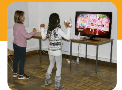
Tournoi « Just Dance »

Pour en savoir plus : http://assoapb.blogspot.fr Pour les contacter : asso.agirpourballancourt@laposte.net . 🎮