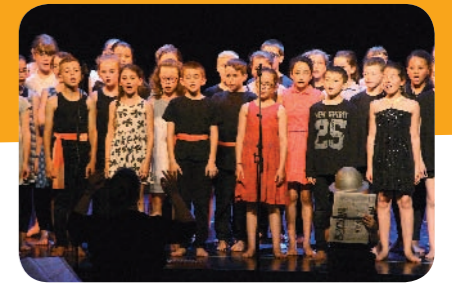
La prestation des élèves de l'école élémentaire Saint-Martin

Merci et bravo aux élèves pour ce merveilleux moment partagé qui a enchanté le public présent et merci aux enseignants pour leur investissement. 🎭