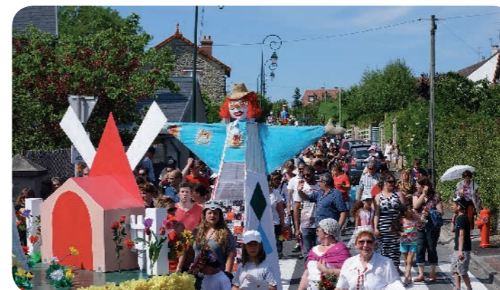
A milieu du cortège le bonhomme Vaval qui finira brûlé à l'arrivée