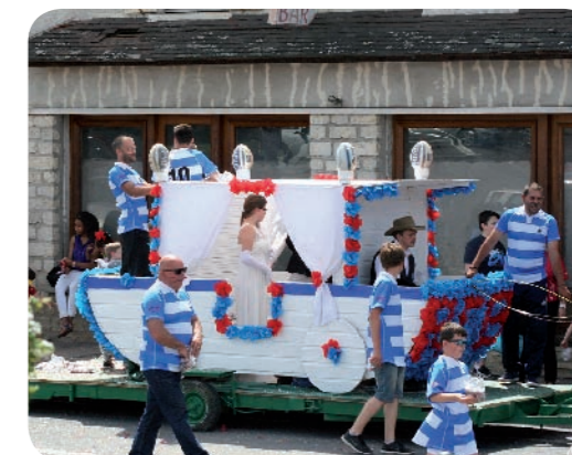
Le char du club de rugby, en bleu et blanc