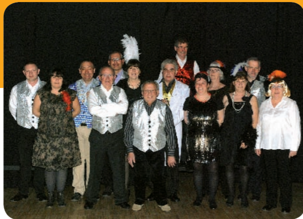
L'équipe du Comité des fêtes organisatrice de l'évènement cabaret