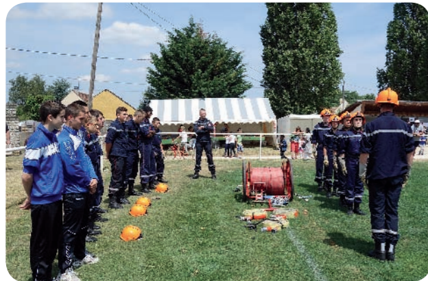
Les jeunes pompiers ont ouvert la fête

Ce fut pour tous une très belle journée. Les gains de cette manifestation permettront de satisfaire pour la prochaine année scolaire, les projets mis en place par les enseignants. Un grand merci aux enfants, aux enseignants, aux bénévoles et aux services scolaire et technique de la mairie. 🍪