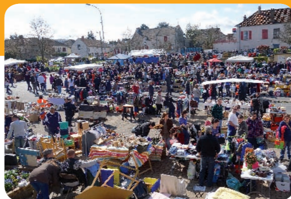
La foule des grands jours dans le centre de Ballancourt

Pour l'organisation du dimanche 12 avril, les travaux de la rue du Martroy ont quelque peu chamboulé le plan d'installation des stands et les exposants se sont ainsi retrouvés plus centralisés sur la place tout autour de la mairie. Pour le plus grand plaisir de tous (flâneurs et participants), le soleil était au rendez-vous. 🌞