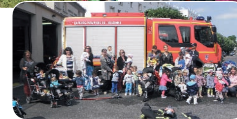
Visite chez les sapeurs-pompiers