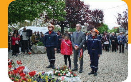
Dépôt de gerbe par le maire entouré des jeunes sapeurs-pompiers et d'une déléguée élève