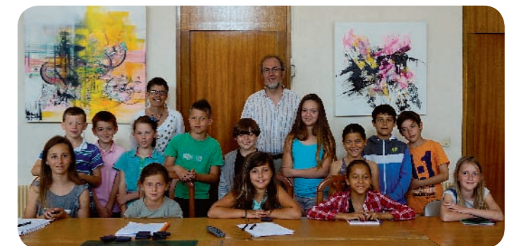
Les délégués écoliers avec le maire et son adjointe à la vie scolaire

Le développement de tableaux numériques dans toutes les classes fait, également, partie des souhaits des représentants des écoliers de Ballancourt.