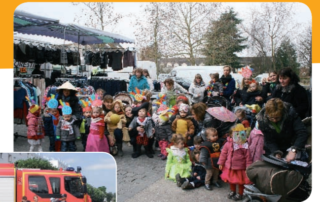
Mini carnaval sur la place du marché