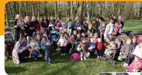
La Chasse aux œufs au parc Christian Imbert