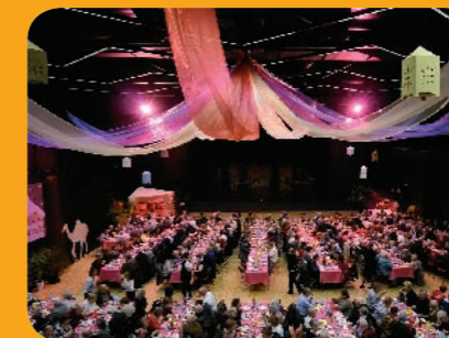
Un espace Salvi féérique