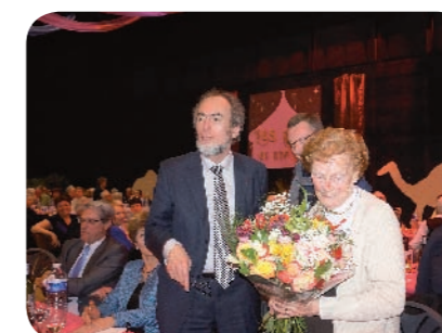
Des fleurs pour Mme Houzé