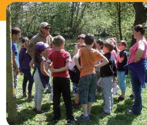
Après le cours théorique...