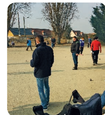
Des joueurs passionnés

L e 14 mars au stade, l'espoir bouliste Ballancourtois organisait un qualificatif en tête à tête avec : - 189 joueurs chez les seniors hommes - 63 joueuses chez les femmes Une très belle journée et un très beau concours avec plusieurs champions de l'Essonne. 🍴