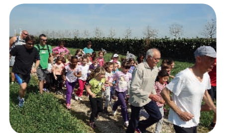
Au départ de la course les filles des écoles élémentaires restent groupées

Cette année, en raison des nouvelles activités périscolaires, le traditionnel cross des écoles s'est déroulé sur deux journées. Le jeudi 9 Avril pour les classes des élémentaires et le mardi matin du 14 avril les petits des écoles maternelles. Le soleil est resté présent sur les deux jours, sans trop de chaleur. Un temps idéal pour nos écoliers qui ont tous été performants. 🏃