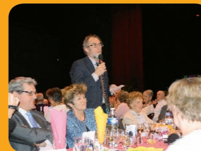
Le maire s'adresse aux aînés socles de la famille Ballancourtois

Comme les grands, élémentaires et collège qui bénéficie de séances de cinéma dans le cadre de « l'école et le cinéma », les petits des écoles maternelles de la Croix-Boissée et Pasteur ont pu assister jeudi 7 mai, à une séance de cinéma adaptée à leur âge. Trois films d'animation leurs étaient proposés : « Capelito et ses amis », « le petit monde de Léo » et « Pat et Mat ». Les enfants, très attentifs, accompagnés de leurs enseignantes, ATSEM et quelques parents sont sortis ravis de la séance. 🏆