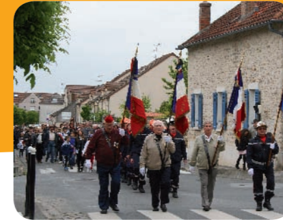
Défilé avec les porte-drapeaux en tête