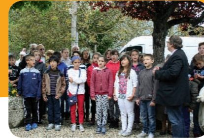
Les écoliers de Jules-Ferry chantent « La Marseillaise »