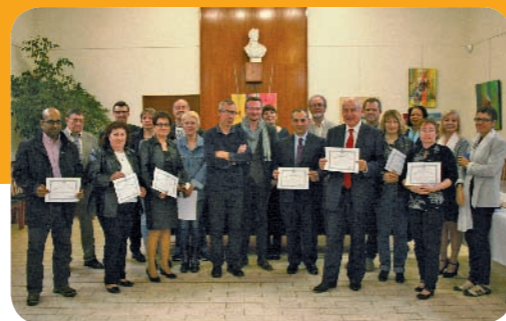
Des travailleurs récompensés