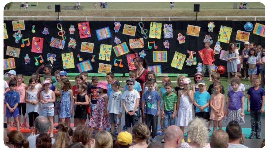
Les chants de l'école Jules Ferry