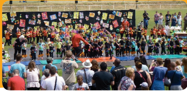
Le cirque de la maternelle Saint-Martin

Samedi 13 Juin sur le stade, a eu lieu la traditionnelle fête des écoles. Cette année, l'ouverture à 12h30 avec la possibilité de se restaurer sur place était une grande première avec le club de Rugby de Ballancourt aux fourneaux.