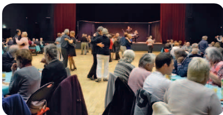
Un petit pas de danse.