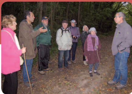
Randonnée encadrée par l'association Rando'Ball.

L'après-midi au ciné toile projection du film « Indian Palace Suite Royale » et ensuite dans la salle de spectacle de l'espace Daniel Salvi le traditionnel thé dansant animé par Georges et ses musiciens accompagnés de deux taxi boys. Une collation était servie avec sa rituelle dégustation de chouquettes. 145 personnes étaient présentes pour le thé dansant. Manifestation qui s'est terminée à 18h. Un grand merci pour tous les participants et aussi à tous ceux et celles qui ont œuvré pour bon déroulement de cette journée. 🍷