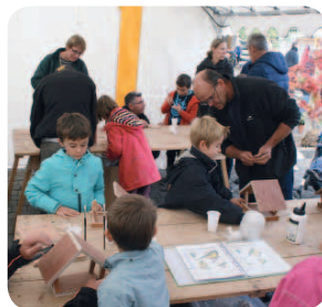
Les enfants accueillis par les agents des services techniques.

Remercions l'ensemble des commerçants et producteurs qui ont proposé des produits de qualité ainsi qu'un service est un accueil chaleureux à la population. Nous vous donnons rendez-vous l'année prochaine pour la troisième édition en espérant une météo tout aussi clémente! 🍂