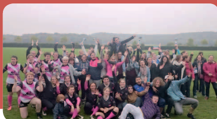
Le rugby, c'est aussi pour les filles !!!

C'est à Ballancourt que le Rugby à 5 féminin s'était donné rendez-vous dimanche 4 octobre pour le traditionnel « Tournoi des Mamans ». Un tournoi 100% féminin que le RC Ballancourt organisait pour la deuxième année consécutive dans une ambiance hyper festive ! Les Crazy Mosquitos de Triel sur Seine l'ont emporté devant les Blackettes de Ballancourt. Mais à vrai dire, c'est surtout une matinée conviviale et amicale dans l'esprit du rugby que l'on retiendra.