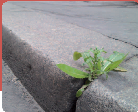
Des caniveaux moins nets, mais pour la bonne cause.

La rivière Essonne et son bassin versant déroulent leur tracé depuis le Loiret, région de Malesherbes, jusqu'à Corbeil-Essonnes. La vallée de l'Essonne est le siège de nombreux enjeux, sa richesse écologique est reconnue et appréciée, avec en particulier les marais de la Basse Vallée, les sites classés Natura 2000, les Espaces Naturels Sensibles.