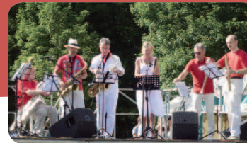
Le groupe du Conservatoire a fait un tabac.