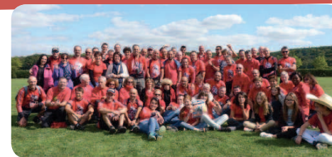
Il faut du monde pour accueillir près de 1500 vététistes !!!

Sans failir à la tradition, le club VTT Ballancourt a organisé, pour la onzième fois, le dimanche 6 septembre dernier, sa désormais incontournable randonnée annuelle. Un soleil radieux illuminait le Gâtinais ce jour-là et cela a certainement poussé les 1440 participants à se lever tôt pour en découdre sur les six parcours proposés. Afin d'éviter certains engorgements, parfois mal vécus l'an passé, les parcours 22, 31 et 42 kilomètres étaient séparés des 49, 62 et 72 kilomètres.