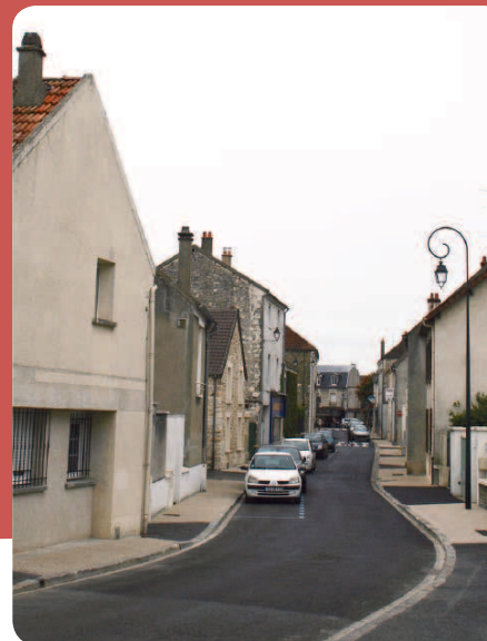
La rue débarrassée de ses fils disgracieux.

Pierre SEMUR, Premier adjoint au maire chargé des travaux