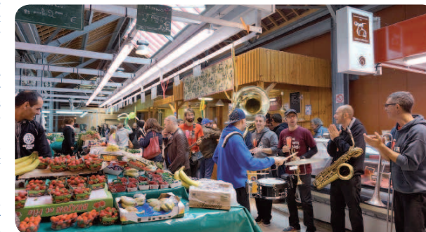
La fanfare «No Water Please» a fait l'animation.