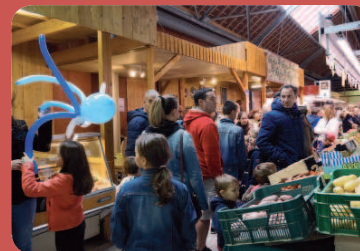
La foule des grands jours en ce dimanche 4 octobre.