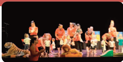
Les tout-petits dans un décor de savane, sur la scène de l'espace Daniel Salvi.

Le spectacle de fin d'année du Relais Assistant Maternel a connu un vif succès malgré la température caniculaire. Les parents ont répondu présent à l'invitation des assistantes maternelles et du RAM, vendredi 8 juillet, à l'espace Daniel Salvi.