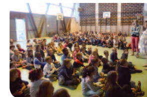
Les élèves de primaire rassemblés dans le gymnase pour la rentrée de l'école Saint-Martin.

Après 16h30, les enfants peuvent fréquenter l'étude ou les accueils périscolaires du soir. 🍷