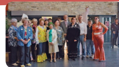
Les bénévoles de l'association posent avec le maire.

La 4 ème édition du salon des métiers du terroir et de l'artisanat s'est déroulée le week-end du 2, 3 et 4 octobre à l'espace Daniel Salvi. Cette année le thème retenu était « les années disco de l'artisanat ». Tous les bénévoles avaient joué le jeu en revêtant des tenues d'époque. Au détour des allées les visiteurs ont pu déguster quelques gourmandises, mais aussi apprécier l'artisanat en tout genre. 🍷