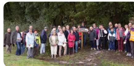
Les marcheurs en route vers les roches du Père la Musique.

C'est un magnifique décor aux couleurs de la savane, qui nous a fait voyager à travers cette région, à la rencontre des animaux sauvages. Les enfants ont offert un beau spectacle intitulé « Albina la girafe », sous les yeux attendrissant des parents. Cette fin de soirée s'est terminée par un pot de l'amitié offert par la mairie et des entrées salées confectionnés, pour l'occasion, par les parents. 🍷