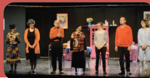
La troupe de CUBE très applaudie pour sa pièce de théâtre intitulée « ça sent le sapin ».

Bravo à tous et rendez-vous l'an prochain. 📺