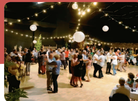
Apprentissage de la salsa, attention aux pieds de votre partenaire !!!!