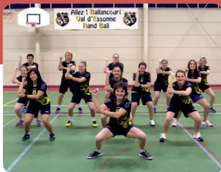
Le « Haka » des handballeuses.

Les entraînements des Séniors Féminines se déroulent chaque mardi à 20 h à la Halle multisports intercommunale de Champcueil. N'hésitez pas à venir faire un essai !