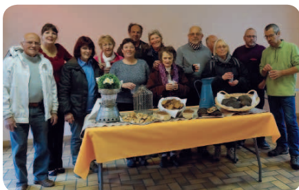
Après l'effort le réconfort ! Avec une dégustation de pains spéciaux.