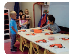
Les moyens de maternelle de l'école Saint-Martin.