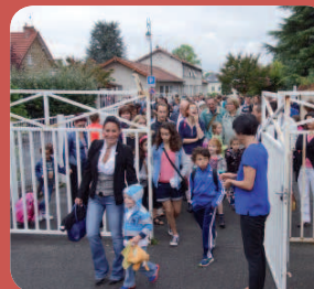
Le jour de la rentrée à l'école Jules Ferry.