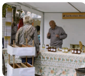
Du miel à déguster.