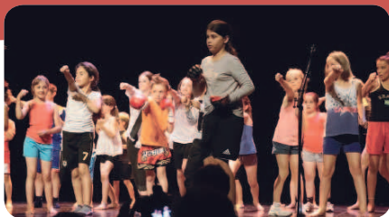
« Rocky » pour l'école Jules Ferry.

Le vendredi 19 Juin, l'école maternelle Pasteur a présenté à l'espace Daniel Salvi une exposition spectacle « tout en couleur ». Après avoir visité la très belle exposition présentée dans le hall de l'espace, les parents ont pu ensuite assister à un spectacle très coloré de danses et de chants.