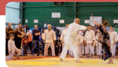
Une femme doit savoir se défendre !!!

Cette année encore les associations ont fait leur rentrée lors du forum des associations organisé le dimanche 6 septembre au gymnase Pierre Denize. Les futurs adhérents ont pu ainsi s'inscrire sur l'activité qu'ils avaient choisie. Les démonstrations d'arts martiaux et de danse ont fait le plein de public. Nous réfléchissons pour organiser cela différemment l'an prochain. 🍷