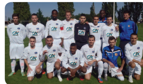
L'équipe du Football Club de Ballancourt.

La coupe de France 4 ème tour de football s'est déroulée dimanche 27 septembre sur le stade de Ballancourt contre l'équipe C.F.A Boulogne Billancourt. Malgré une très belle prestation contre une équipe très supérieure, Ballancourt s'est incliné 1 à 4 et quitte la Coupe de France. 🏆