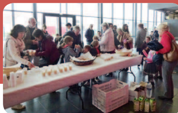
Petite collation à la sortie du cinéma.

Ciné Toile, toujours très fréquenté pendant les vacances scolaires avec une programmation adaptée à nos jeunes, a organisé une séance spéciale pour les petits avec le film d'animation « les fables de Monsieur Renard ». Cette séance était suivie d'un petit déjeuner vitaminé. A la fin de la séance, les petits, ravis d'avoir pu fréquenter le cinéma comme les grands, accompagnés de leurs parents ou grands-parents, étaient tous enthousiasmés. 📺