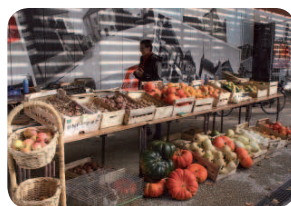
Des produits biologiques à acheter.