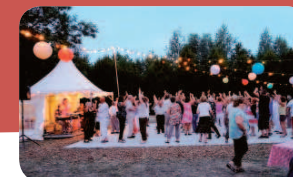
Une ambiance joyeuse sur la piste de danse du Parc Imbert.

L'après-midi, ce sont des animations gratuites qui ont été mises en place, en collaboration avec la Médiathèque avec une promenade contée, un concert pour enfant, des livres voyageurs etc.