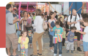
La traditionnelle distribution des lampions sur la fête foraine.

avaient pris place. A cette occasion, un tour de manège gratuit était offert aux personnes ramenant leur lampion. Un DJ s'était installé au stade pour faire danser ceux qui le souhaitait avec la possibilité de se restaurer sur place,