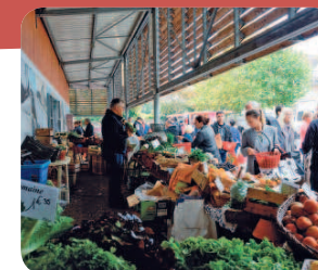
De nouveaux étals très appréciés.

« Une ville comme Ballancourt se doit d'avoir un marché dynamique », écrivait le maire dans un éditorial. Espérons que les Ballancourtois seront nombreux à faire vivre ce lieu d'échanges et de convivialité! 🍂