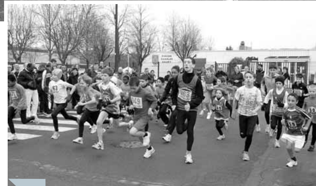
Les enfants étaient aussi du rendez-vous mais sur de plus courtes distances. Il n'empêche que leurs petites jambes allaient aussi vite que celles de leurs aînés. 5 Etampoises ont d'ailleurs fini dans les 8 premiers au classement final. Bravo !