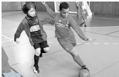
Les jeunes Etampoises, toutes catégories confondues, ont fait étalage de leur maîtrise technique et de leur volonté de gagner.