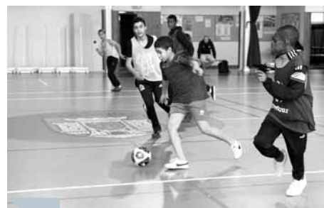
Les vacances auront été aussi pour les jeunes d'Etampes l'occasion de pratiquer du badminton, du tennis de table... mais l'activité reine d'entre toutes reste le football. 1 er sport national oblige !