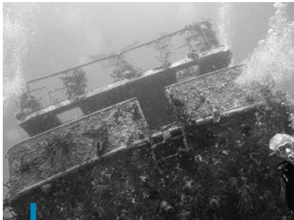
Mystère et splendeur autour du Mana Vina, l'épave d'un bateau formant un récif artificiel.