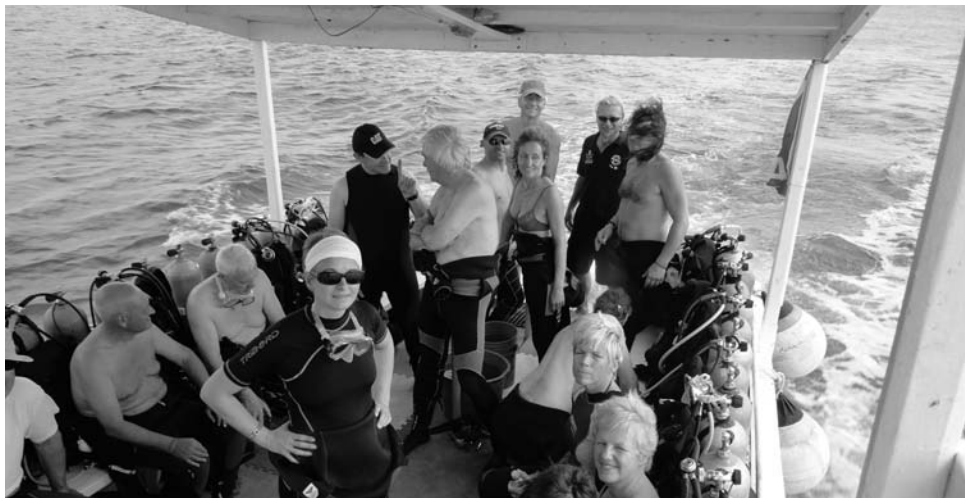
A bord du bateau, les plongeurs étaient dans l'ambiance « Grand bleu ».