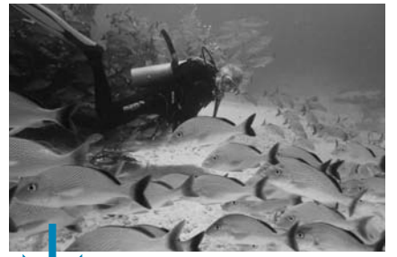
Tortues de mer, bancs de lutjans, gorgones, poissons crapauds, une espèce endémique de l'île de Cozumel, murène, ... un véritable aquarium géant...