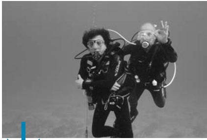
Que du bonheur, au rendez-vous des 12 plongées !