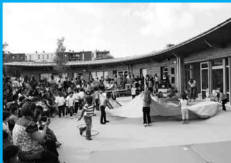
La première du Petit-Prince Les enfants ont joué les accrobates sur la grande muraille de Chine.