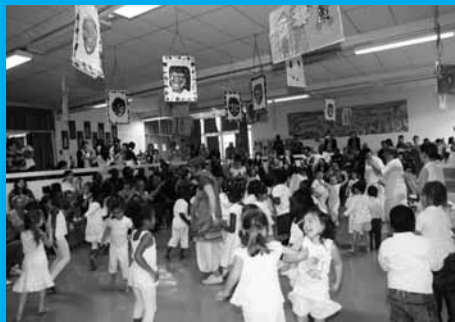
Elsa-Triolet en Afrique Après un défilé, les enfants ont pu danser au son des djembés.