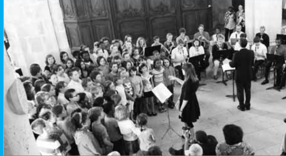
A l'église Saint-Basile le 21 juin pour la fête de la musique. Les petits créateurs de l'école des Prés ont donné une représentation.