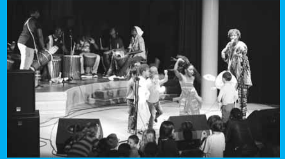
Enfants et adultes ont partagé la scène de l'Espace Jean-Carmet pour présenter des spectacles qui ont ravi le public.

► Plus de photos sur www.mairie-etampes.fr