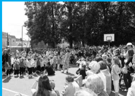
En chœur à Hélène-Boucher Les élèves ont constitué une chorale pour la plus grande fierté de leurs parents.