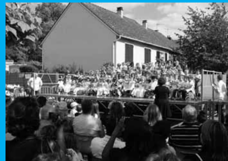
Kergomard au Moyen Age Damoiselles et damoiseaux ont donné rendez-vous dans leur château !