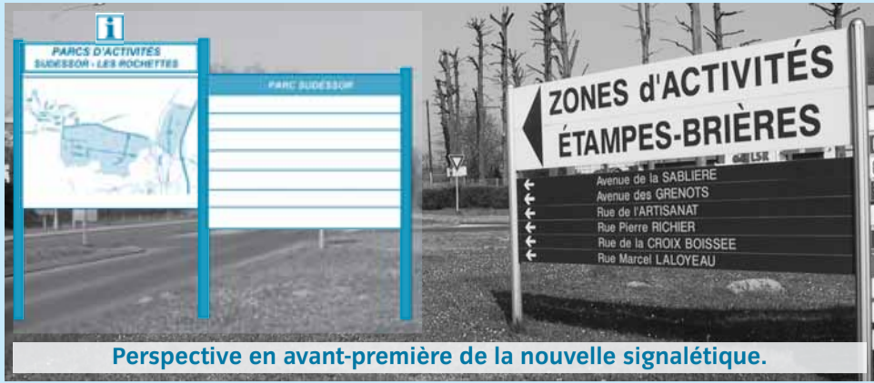
Perspective en avant-première de la nouvelle signalétique.