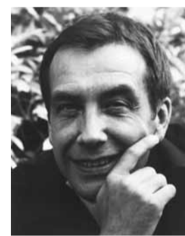
musiciens d'OSE et du festival de Musique en Catalogne Romane écrit et compose actuellement un nouvel Opéra d'enfant pour la Ville d'Etampes.