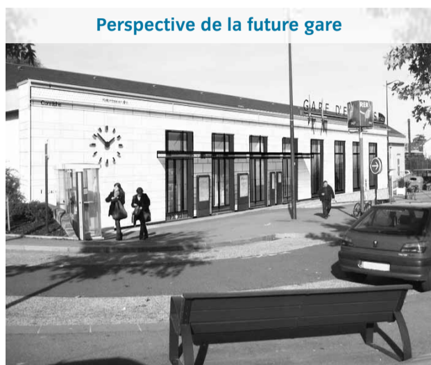
Perspective de la future gare

comportements suspects près de chez eux comme des véhicules qui rôdent autour d'une maison par exemple. Cette semaine, Breuillet et Saint-Yon ont signé avec le Préfet des premières conventions de participation citoyenne du département. Les « Voisins vigilants » de ces deux communes seront désormais en contact avec leur gendarmerie.