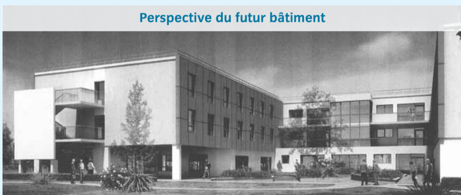
Perspective du futur bâtiment

LA POSE DE LA 1 RE PIERRE ne saurait tarder. Le début des travaux de construction de l'Etablissement d'Hébergement pour Personnes Agées Dépendantes (EHPAD) est prévu pour les jours à venir. Pleinement intégrée au projet médical de l'hôpital qui souhaite créer une filière gériatrique complète (moyen et long séjour existants, court séjour en gestation), cette nouvelle construction vient en remplacement de l'actuelle Maison de retraite. Début novembre commencera à sortir de terre, dans la parcelle jouxtant les Urgences, un bâtiment d'une superficie de 1 400 m 2 comprenant 126 lits répartis sur trois niveaux. Implanté sur 5 900 m 2 de surface constructible, le bâtiment, d'un coût de 17 M€ comprendra aussi une salle polyvalente et une cuisine thérapeutique qui seront aménagées au rez-de-chaussée. Les chambres de 20 m 2 seront individuelles avec