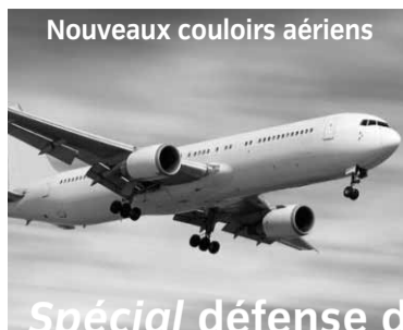
Nouveaux couloirs aériens