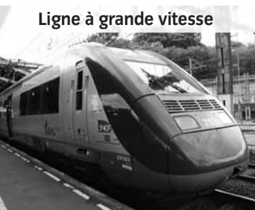
Ligne à grande vitesse