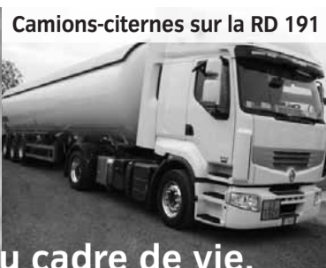
Camions-citernes sur la RD 191