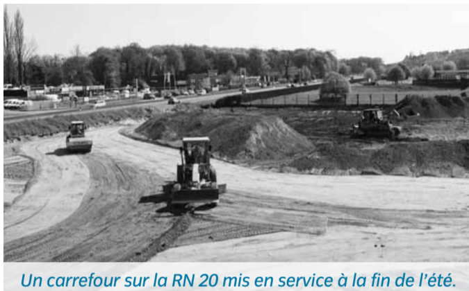
Un carrefour sur la RN 20 mis en service à la fin de l'été.

LUNDI 15 AVRIL , les bulldozers, les pelleteuses, les tracteurs-bennes et une dizaine de camions semi-remorques ont commencé les travaux d'une opération de 6 M€ qui verra la création d'une voie de liaison entre la RN 20 et le pont-rail mais aussi la réalisation d'un fossé pour un bassin de rétention des eaux pluviales. La difficulté majeure de ce chantier est la mise en place d'un carrefour giratoire au niveau de l'ancienne station service, située près de l'entreprise Case New Holland le long de la RN 20. « Cette 1 re phase se déroulera jusqu'en juin sans pénaliser la circulation », annonce Didier Faufrage, le Chef du service Grands Projets de Déplacements du Conseil général. La suite des opérations impliquera, quant à elle, quelques aménagements de la circulation. « A partir du 3 juillet, pendant la 2 e phase des travaux qui consistera à élargir la RN 20 dans le sens Province-Paris pour assurer l'accès aux activités commerciales riveraines dans de bonnes conditions de sécurité, la circulation sera réduite à une voie. La 3 e phase, qui débutera après le 14 juillet, visera à achever le rond-point