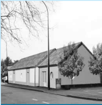
Perspective de la future maison des syndicats.