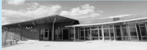
L'école maternelle Le Petit-Prince est le 15 e bureau de vote d'Etampes.

Pour savoir où voter, rien de plus facile. Il suffit de vérifier l'adresse sur votre carte d'électeur. Auparavant, la Ville comptait 14 bureaux de vote. Aujourd'hui, un 15 e a vu le jour au groupe scolaire Le Petit-Prince. En effet, selon l'arrêté préfectoral du 5 août 2013, une modification importante est intervenue en matière de découpage géographique électoral. Conformément aux dispositions du code électoral, le nombre d'électeurs par bureau de vote doit être compris en 800 et 1 000. En raison d'un plus grand nombre d'électrices et d'électeurs recensés dans la commune, il a donc fallu ouvrir un nouveau lieu afin de permettre à chacun de faire son devoir de citoyen dans de bonnes conditions.