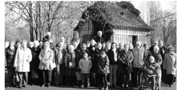
Les nombreux adhérents étaient fidèles au rendez-vous lors de l'Assemblée générale en janvier dernier.