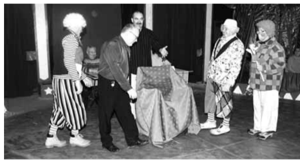
Soirée sous le chapiteau du Cirque Star en février 2009.