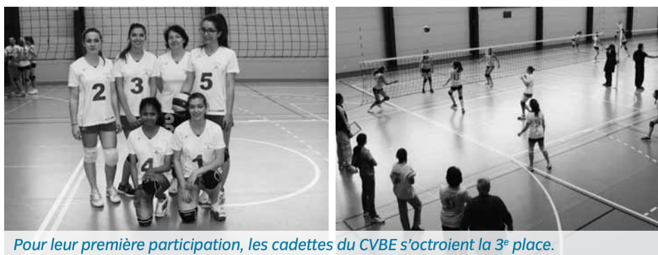
Pour leur première participation, les cadettes du CVBE s'octroient la 3 e place.