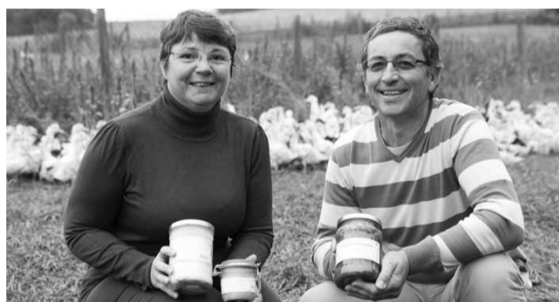
Venue de Puiset-le-Marais, la Ferme du Grand Clos fera découvrir son foie gras artisanal.