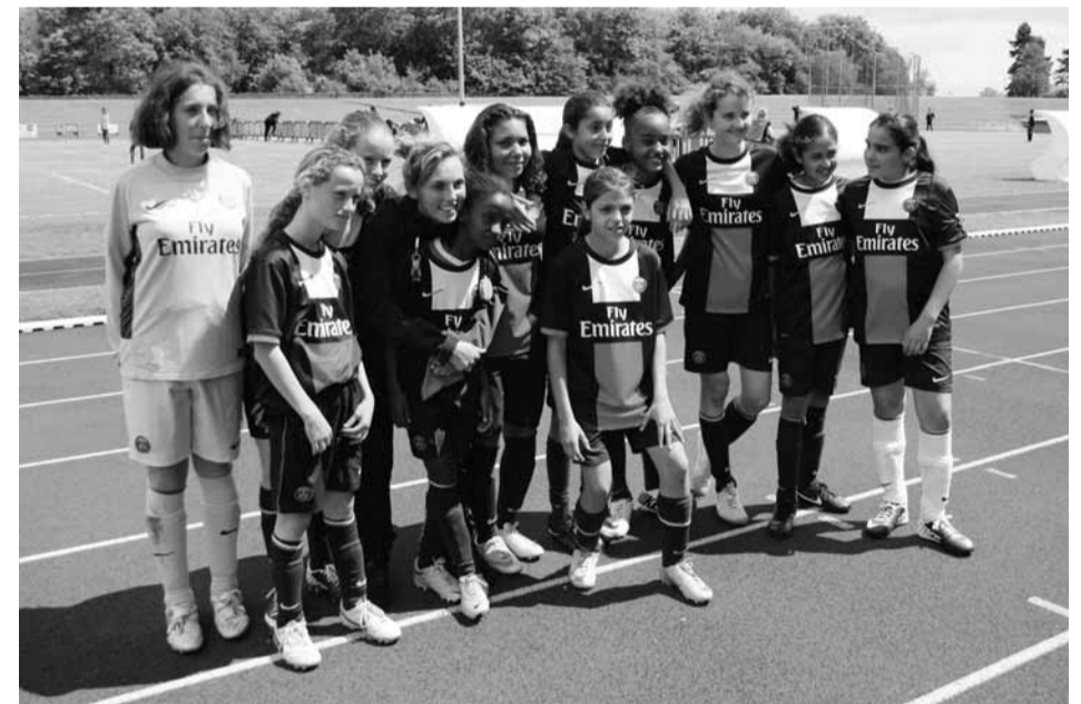
Pour la première fois, les organisateurs du Challenge des étoiles ont réussi à faire venir une équipe féminine, celle du PSG.