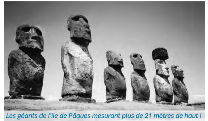
Les géants de l'île de Pâques mesurant plus de 21 mètres de haut !

ce lieu où la raréfaction de l'air rend le moindre effort difficile, voire impossible, se trouvent des pierres de 60 tonnes qui ont servi à l'édification de gigantesques enceintes. L'une d'elles est ornée de têtes anthropomorphes (NDLR : qui a la forme, l'apparence humaine), dont la signification demeure inconnue », déclare l'auteur. Mais d'où viendraient ces géants bâtisseurs ? Seraient-ils les habitants de l'Atlantide, la cité grecque engloutie mentionnée pour la première fois par Platon dans ses dialogues, "Timée" et "Critias" ? Entre légende et découverte scientifique, voilà ce que vous propose de découvrir l'auteur de cet étonnant ouvrage disponible au Centre culturel E.Leclerc et sur le site Amazon.