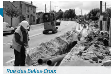
Rue des Belles-Croix

> RD 191 (du cimetière Saint-Pierre au Centre E.Leclerc), plateau de Guinette, bd Henri-IV, de la rue des Belles-Croix à la rue Louis-Moreau, et rue du Sablon : réfection de la signalisation horizontale (passage piéton, lignes blanches, ...).