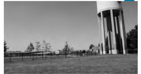
L'espace de jeux des enfants va être agrandi à l'école Le Petit-Prince.

Après une réunion fin juin avec les services de la Ville et la directrice, l'école élémentaire Le Petit-Prince va s'étendre pendant les vacances. Le Maire a décidé lors d'une réunion la mise à disposition d'un terrain afin d'agrandir l'aire de récréation, entre l'école et le Château d'eau. Toute la structure pourra ainsi profiter d'un grand espace délimité et sécurisé, notamment pour pratiquer des activités sportives.