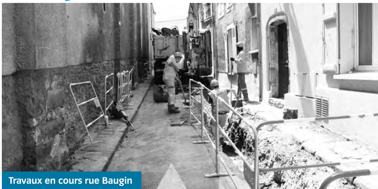
Travaux en cours rue Baugin