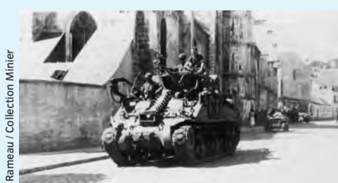
Un char américain remontant la rue de la République.

« Je travaillais au café de la Tour Penchée en face de l'église. Nous étions à la cave quand les chars sont arrivés. Avec ma patronne, nous sommes montées et nous avons donné aux Américains du vin blanc et du jus de fruit. J'avais 20 ans et les cheveux longs. Je me souviens que plusieurs Américains ont voulu me couper des mèches de cheveux pour garder le souvenir d'une Etampoise libérée ! »