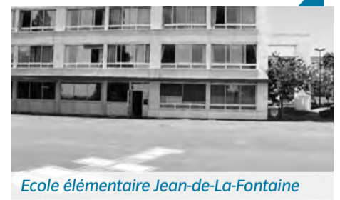
Ecole élémentaire Jean-de-La-Fontaine

> A Elsa-Triolet (création d'un muret sous la clôture...), au Groupe scolaire Jacques-Prévert (renforcement de l'éclairage extérieur...), à André Buvat (réaménagement de 2 classes...), à Jean-de-La-Fontaine élémentaire (remplacement du portail). Toutes les écoles feront comme chaque année l'objet de travaux particuliers.