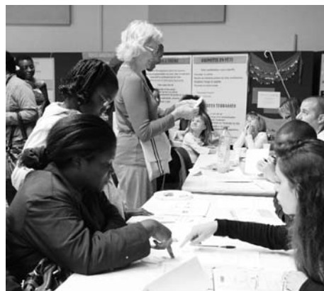
Portes ouvertes 2013 à l'Espace Jean-Carmet

SERVICES DE PROXIMITÉ, ACTIVITÉS POUR TOUS, CONVIVIALITÉ. La rentrée va se décliner selon ces 3 thèmes dans les Maisons de quartier Jean-Carmet et Camille-Claudiel.