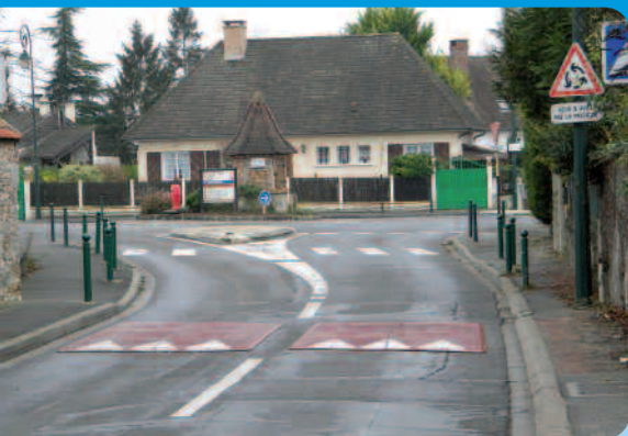
Coussin berlinois, rue de la Station.

En novembre-décembre 2010, nous avons fait des mesures de trafic rue de la Station dans la partie située sur le plateau entre le rond-point du 8 mai 1945 et le rond-point des Fours à Chaux. Ces mesures ont fait apparaître un trafic moyen journalier de 3286 véhicules pour les deux sens de circulation dont une cinquantaine de camions. La vitesse moyenne des véhicules était de 44,5 km/h pour les véhicules légers et de 33,6 km/h pour les poids lourds.