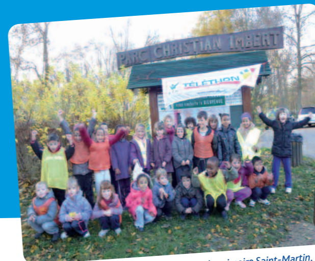
Le fil rouge (cross) des enfants de l'école primaire Saint-Martin.