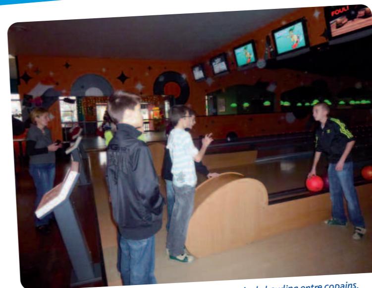
partie de bowling entre copains.

Vingt jeunes ont participé à cette sortie, ils étaient tous au Rendez-vous à la gare pour se rendre au bowling de Mennecey. Nous avons tous passé un moment très agréable et nous espérons pouvoir renouveler cette expérience sur de prochaines vacances. Un grand merci aux deux mamans qui sont venus nous aider.