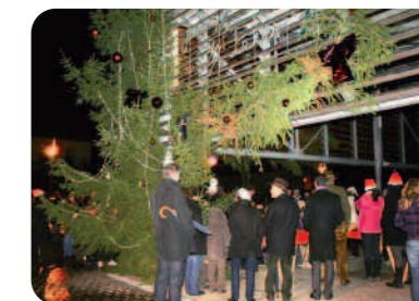
Illumination du sapin géant.

Malgré le froid et la pluie les enfants de CE2 de l'école Saint-Martin ont entonné des chants de Noël dans une ambiance conviviale. Chacun a pu ensuite se réchauffer par un chocolat ou un vin chaud servi pour l'occasion.