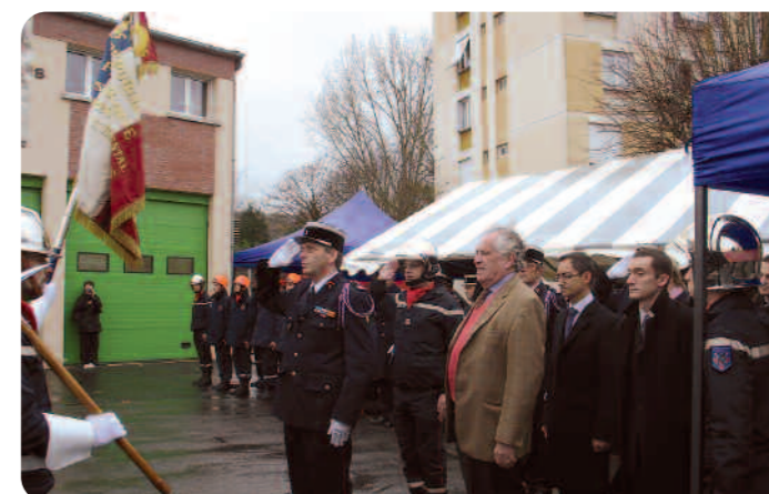
Les personnalités saluent le drapeau des sapeurs-pompiers.