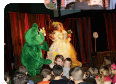
Miss Loulou chahutée par une grenouille.