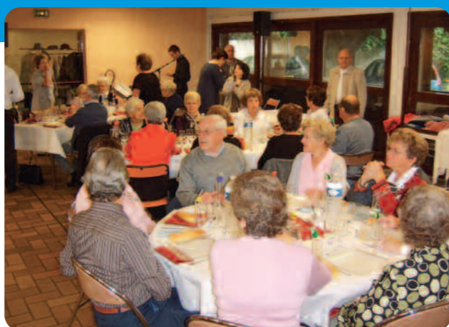
Une choucroute très appréciée.