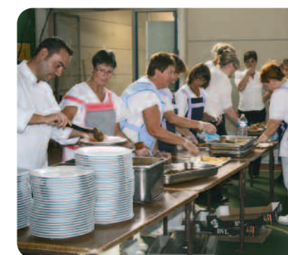
L'équipe du restaurant municipal, les élèves de l'école hôtelière et le personnel communal en pleine action.