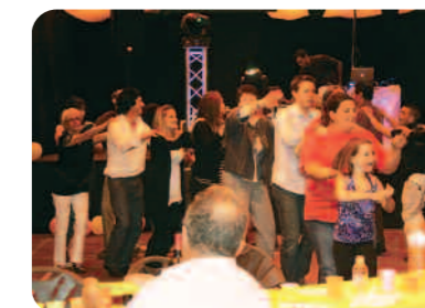
Un petit tour de chenille.

Après le repas, les convives ont envahi la piste de danse pour s'agiter sur des tubes incontournables comme « les démons de minuits » ou « Alexandrie, Alexandra ».