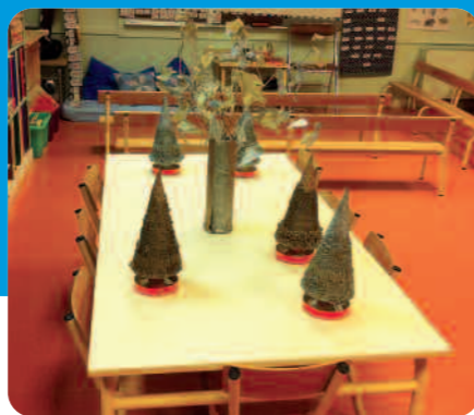
Objets réalisés avec des végétaux.