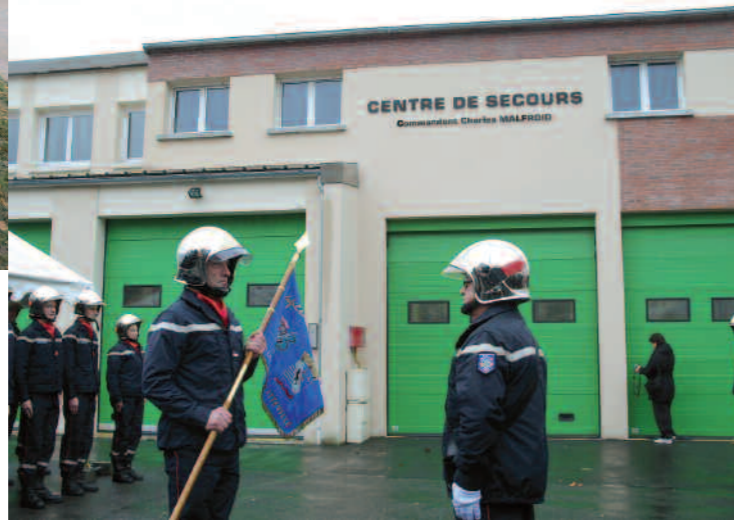
Le centre de secours Charles Malfroid (page 3)