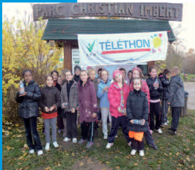
Les enfants du Téléthon (page 13)