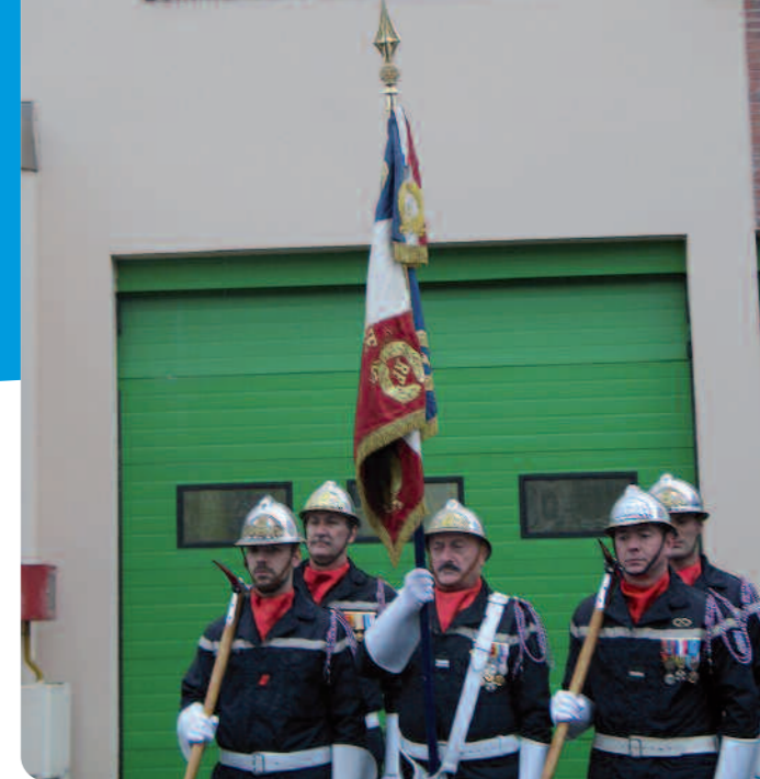
Le centre de secours baptisé.