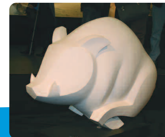
Sculpture "Sanglier chargeant" de Guy GEYMANN.