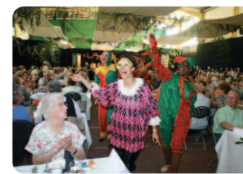
La troupe des Lutins de la rue Orange invite les aînés à danser.