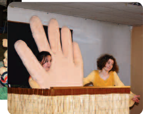
Histoires pour deux mains.

Comme chaque année, Le RAM a fêté « la Journée Nationale des Assistants Maternels » dont le thème cette année était « L'enfant et le jeu ».