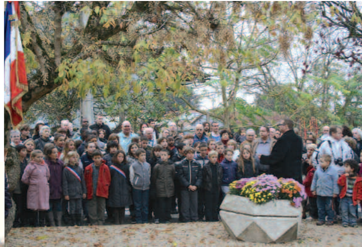
La Marseillaise du 11 novembre (page 12)