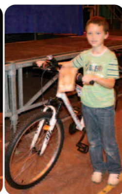
Un vélo pour un jeune Ballancourtois gagnant du 2 ème lot.