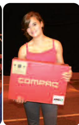
En 1 er lot, un ordinateur portable pour une Ballancourtoise.