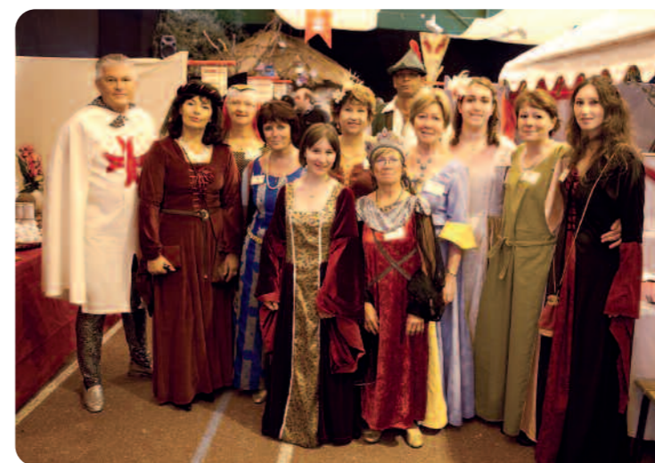
L'équipe de bénévoles en costume médiéval.