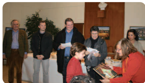
Remise de lots aux gagnants du livret-jeux.