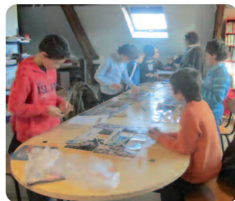
Ateliers jeux de société, tous les derniers samedis du mois.