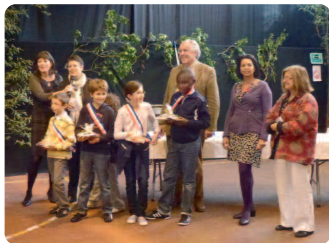
Les nouveaux élus récompensés.