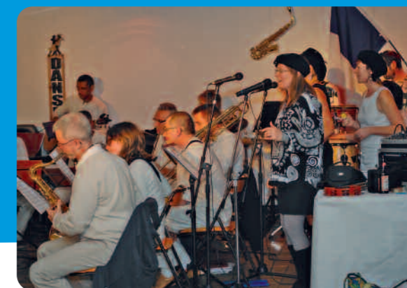
Le Big Band Jazzabaya.

La chaleur de la sonorité des cuivres soutenus par une rythmique implacable et le