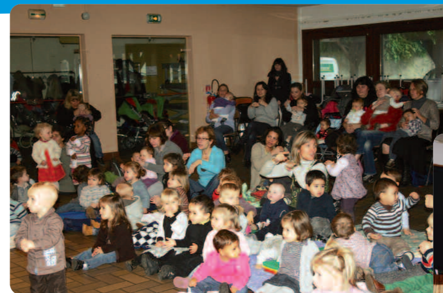
Un public attentif.

L'animatrice avait organisé pour les assistantes maternelles du RAM, une soirée conférence-jeu animée par l'ALIF (Association des Ludothèques d'Ile-de-France) vendredi 18 novembre de 19h00 à 22h30 à la Maison Nouvelle Génération. Après une petite conférence sur le thème du jeu, les deux ludothécaires ont fait découvrir aux assistantes maternelles des jouets et jeux de société originaux et innovants.