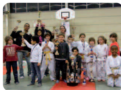
Des récompenses méritées.

Un grand merci à tous, combattants et bénévoles. Rendez-vous l'année prochaine.