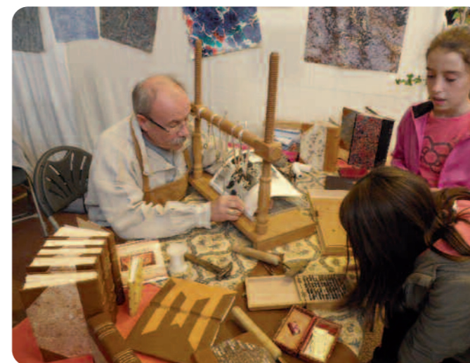
Les enfants très attentifs au travail des artisans.

Au total, ce sont quarante trois exposants artisans et producteurs passionnés par leurs métiers qui les anime. Tourneur sur bois, coutelier, ferronnier, tailleur de pierre, ébéniste d'art et graveur ont exposé leur art à la manière d'autrefois tandis que les métiers de bouche faisaient déguster des mets appétissants comme le lait d'ânesse, l'hydromel, le fois gras et bien d'autres encore. Rendez vous est pris pour l'année prochaine.