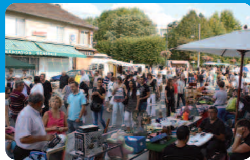
A la recherche de l'objet rare.

Le Comité des fêtes remercie tous les commerçants et sponsors ayant contribué à la dotation des lots.