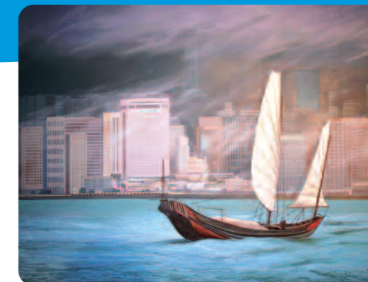
La baie de Hong Kong de Michèle BATTUT.