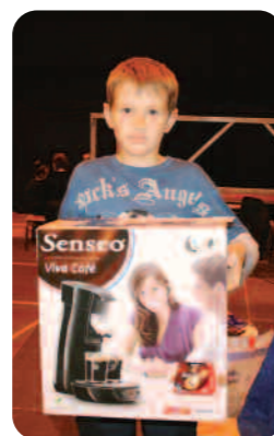
Une Senseo comme 3 ème lot pour un Menneçois.