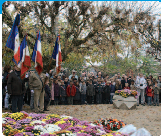
Les élèves de l'école Jules Ferry entonnent la Marseillaise.

Il y avait beaucoup de monde, vendredi 11 novembre au matin, pour assister à la 93 ème commémoration de l'armistice du 11 Novembre 1918.