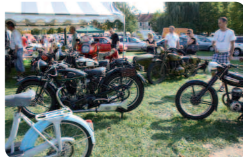
Des motos très anciennes.