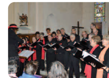
L'Ensemble Vocal de Mennecey en concert dans l'église.

De nombreux spectateurs ont pu apprécier ce concert plein d'émotions quelques jours avant les fêtes de Noël.