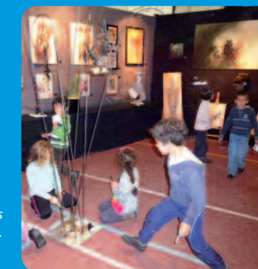
Les écoliers à la découverte de l'art.