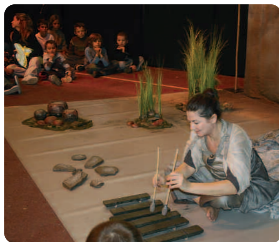
Spectacle "rêves de pierre".