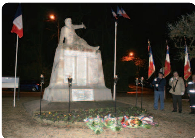
Des flambeaux en hommage aux morts.