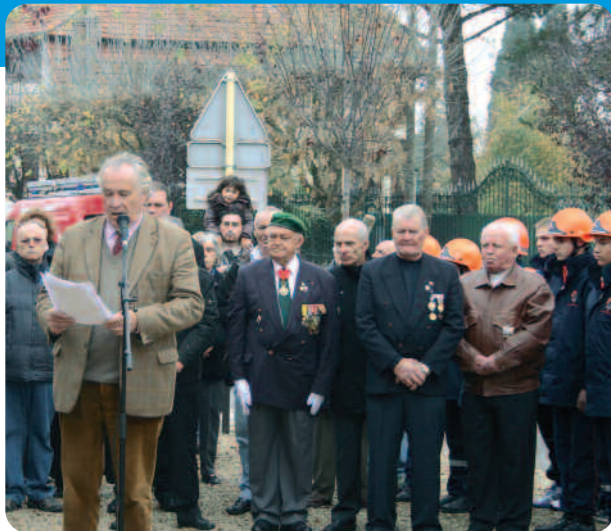
Allocution du maire.