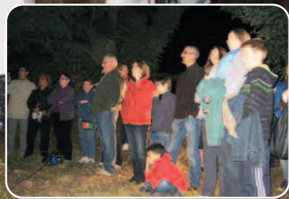
Un public attentif.

Reporté à cause des intempéries, le traditionnel feu d'artifice a été tiré le samedi 15 septembre au château du Saussay, dans le cadre des journées du Patrimoine.