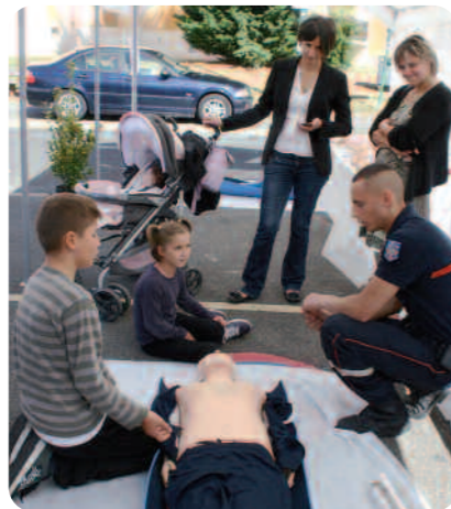
Gestes de premiers secours.

Tout au long de la journée, le public a pu assister à des manœuvres de désincarcération, des démonstrations cynophiles, le maniement de l'échelle à crochet, des baptêmes de plongée en piscine encadrés par le SDIS, des manœuvres d'intervention en milieu périlleux accompagné d'un hélicoptère « Dragon » de la protection civile, des manœuvres d'établissement de lance incendie pour les enfants (encadrées par les jeunes Sapeurs Pompiers) et entrer ainsi dans le quotidien des sapeurs pompiers. Une excellente idée pour faire naître des vocations auprès des enfants qui pouvaient le temps d'une journée devenir les petits héros du jour.