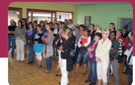
Les enseignants réunis avant la rentrée scolaire.