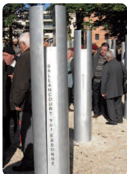
La borne qui représente la commune de Ballancourt.