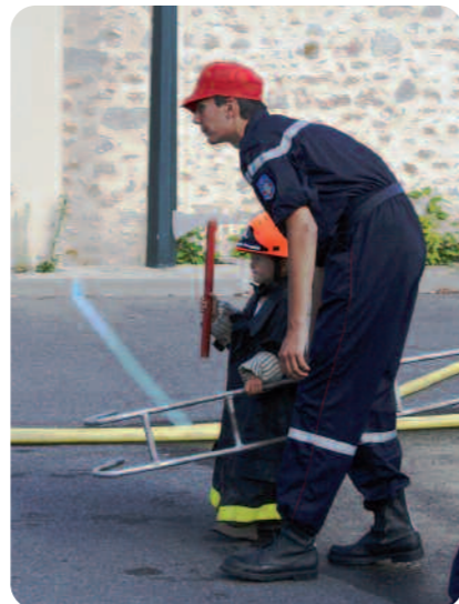
Manœuvre incendie pour les enfants.