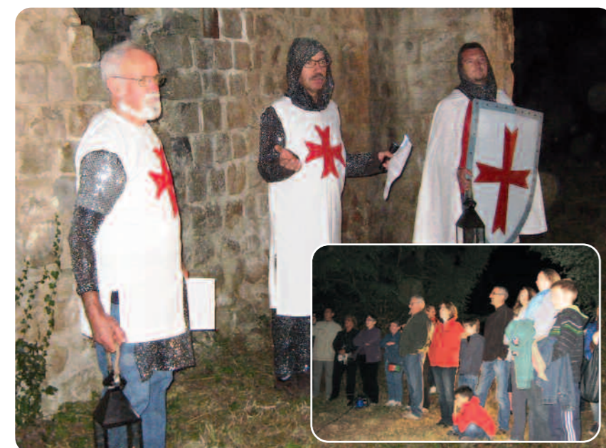
Les templiers font découvrir l'histoire de la chapelle Saint-Blaise.