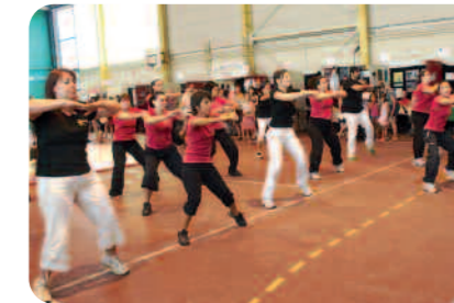
Un sport à la mode la Zumba.