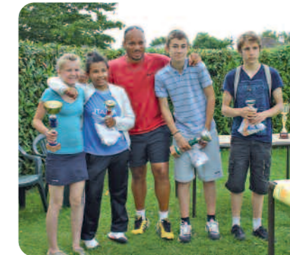
Les finalistes du tournoi interne dans les catégories 13/14 ans filles et 15/16 ans garçons.