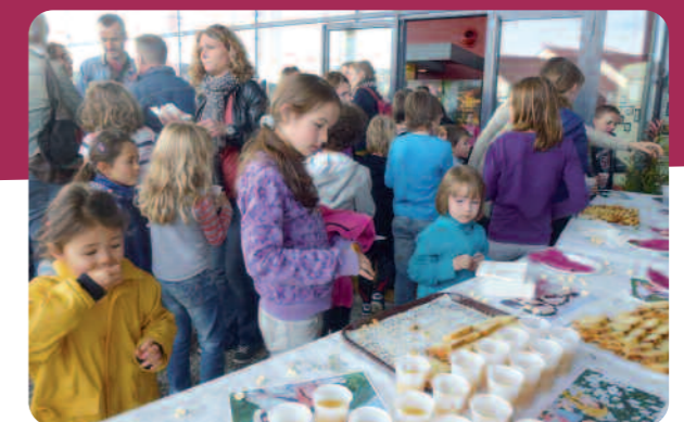
Un goûter très apprécié à la sortie du cinéma.

venus voir ce joli film qui raconte l'histoire de deux enfants qui ont comme père un « homme-loup ». A la fin de la séance, un goûter les attendait sur le parvis de l'Espace Daniel Salvi.