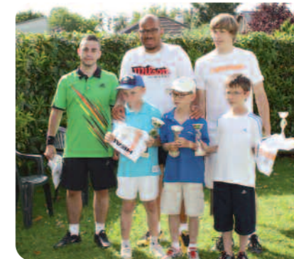
Les finalistes poussins et seniors.

Une mention spéciale cette année à notre équipe féminine 13/14 ans qui a remporté le championnat Interclub de l'Essonne. Félicitations à tous et rendez-vous la saison prochaine pour de nombreux événements.