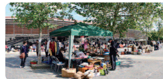
Une brocante pour faire de bonnes affaires sous le soleil.

Après une semaine très pluvieuse, un soleil timide s'est fixé sur Ballancourt samedi 9 juin pour le vide grenier de l'ensemble.