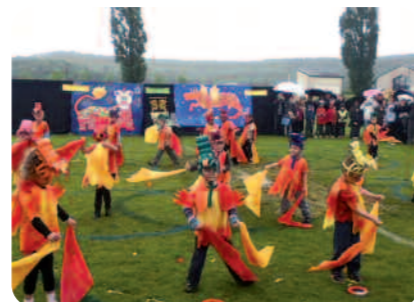
Les petits de l'école maternelle Saint-Martin au pays des dragons.

L a fête des écoles qui a eu lieu sur le stade, samedi 16 juin a été bien arrosée. Ce qui n'a pas empêché les enfants et leurs enseignants de présenter leur spectacle de fin d'année. Les enfants ont pu jouer sur les stands tenus par quelques parents d'élèves et bénévoles. Mais au grand regret des enfants, le traditionnel match de football entre les deux écoles élémentaires a été annulé afin d'éviter des accidents sur le terrain trop boueux.