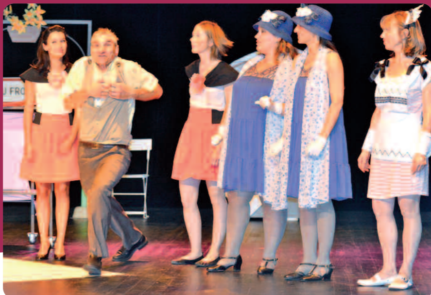
Frou-Frou les Bains de P. Haudecoeur par la Cie des Ondes.