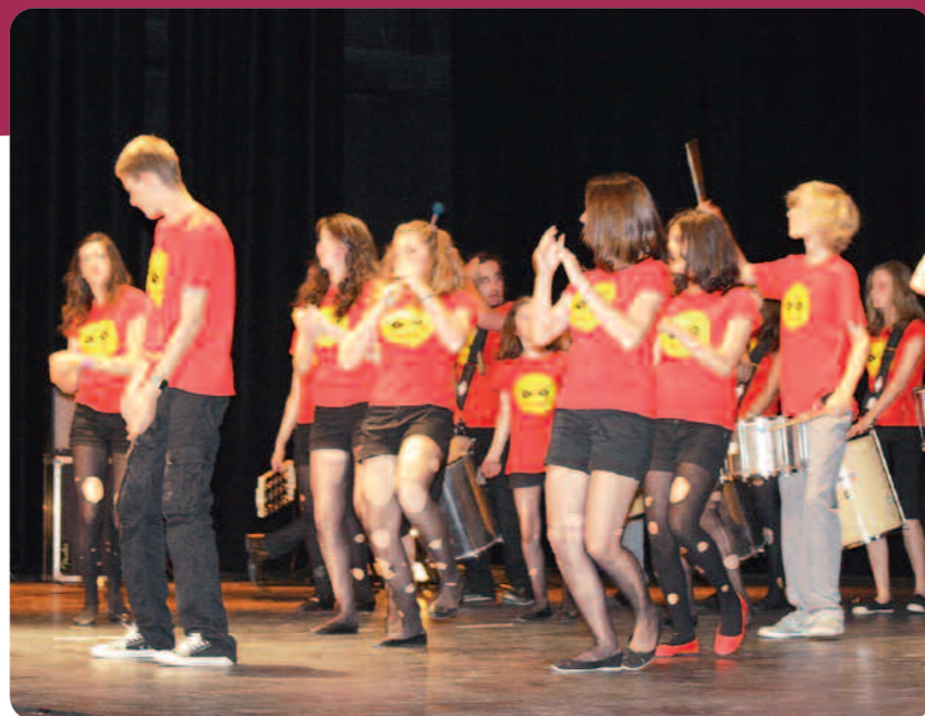
lakatapé, un groupe percussif.

Samedi 30 juin, l'espace Daniel Salvi a accueilli dans sa salle de concert le groupe « lakatapé » qui a présenté son dernier concert « résistance ».