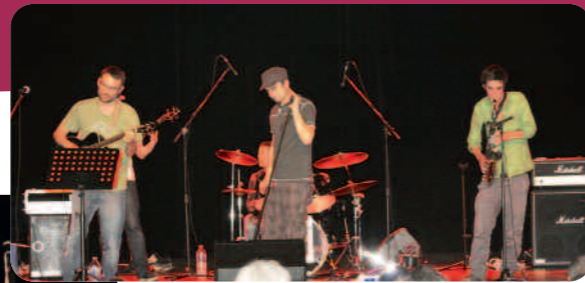
Le groupe Degré Balling.