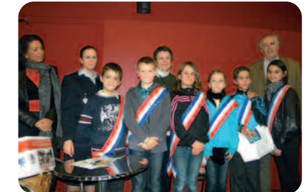
Les délégués de classe de l'école Saint-Martin et Jules Ferry.