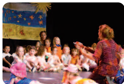
Une grande scène pour des petits bouts.

Samedi 23 juin, les enfants de l'école maternelle Croix Boissée ont alors présenté leur spectacle dans la salle de l'Espace Daniel Salvi. Sous l'œil attentif de leurs parents, les enfants ont emmené les spectateurs au voyage de l'escargot.