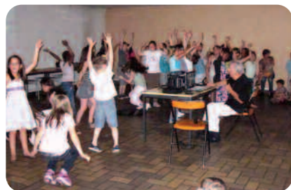
Danse et chants pour les élèves de l'école Jules Ferry.

Merci à M. le Maire d'être venu nous saluer à la salle Varache et à M. le Directeur d'avoir soutenu ces animations.