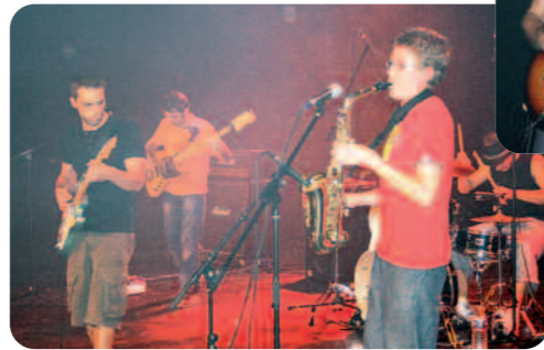
Le groupe Propper Mouche.