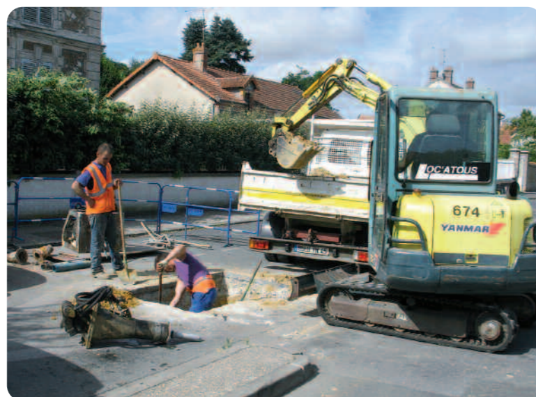
Travaux de branchements plomb rue des écoles