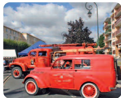
Anciens véhicules de secours.