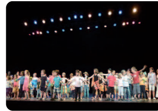
Un spectacle pour une bonne cause.

Les accueils de loisirs ont mis en place sur l'année 2011-2012 un projet de solidarité. Après une vente d'objets fabriqués par les enfants sur le marché, (dont la recette a été versée à l'association) les enfants de 3 à 12 ans qui fréquentent les accueils de loisirs, ont mis en place un spectacle sur le thème des pays du monde. L'objectif de ce spectacle était de rassembler de l'argent pour l'association « Peuple Solidaire Ballancourt ». Chaque mercredi de mai à juin, les enfants ont répété une chorégraphie imaginée par les animateurs