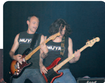
Hard rock avec Muya.