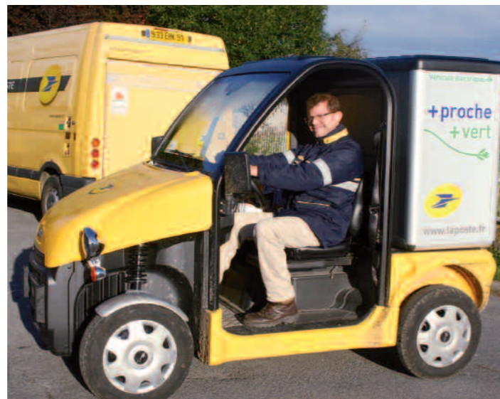
La Poste se met au vert