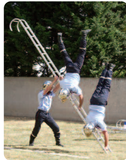
Démonstration d'échelle à crochet.

Cette journée permet, par le biais de diverses activités (tombola, stands) de dégager un bénéfice financier qui sera intégralement reversé au profit de l'œuvre des pupilles des Sapeurs Pompiers.