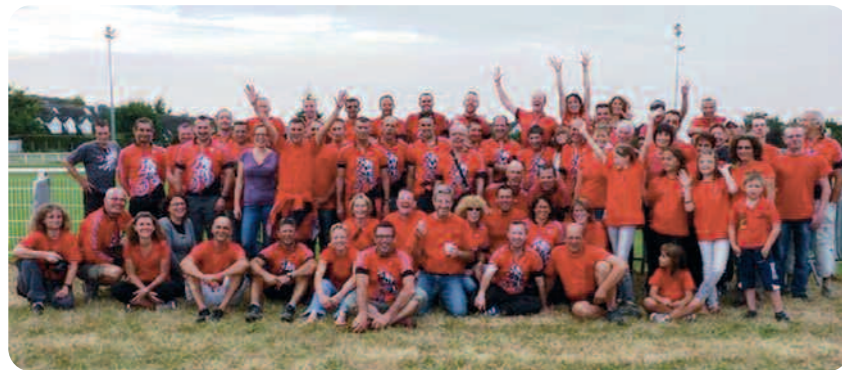
La grande famille du VTT.

Le terrain a été impeccable et la variété des passages, avec quelques nouveautés cette année encore, a conquis l'ensemble des participants ce qui a redonné du baume au cœur aux membres du club et à leur famille qui ont fait en sorte que cette manifestation soit une fête! Que tous ces bénévoles soient remerciés pour leur participation efficace aux ravitaillements, inscriptions, café, sandwiches, balisage et sécurité. Comme une grande famille, ils ont œuvré pour le VTT plaisir, celui qui libère l'esprit et soulage le corps. Rendez-vous est pris pour le dimanche 1 er septembre 2013.