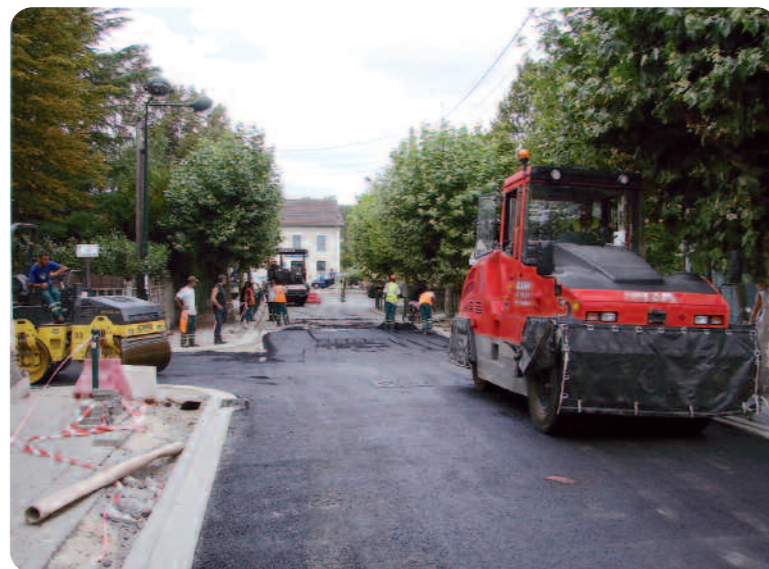
L'angle de la rue de Verdun et de la rue du Général Leclerc.

La forte mobilisation des entreprises a cependant permis de rendre ces rues à la circulation automobile juste avant la rentrée scolaire. Les travaux de réfection complète, des voies de chemin de fer entre Mennecey et la Ferté-Alais ont occasionné une gêne importante pour tous les Ballancourtois et plus particulièrement pour les habitants des rues de l'Essonne, des Fours à Chaux et de la Station.