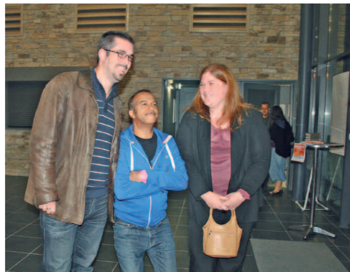
Un grand LEGITIMUS

CINÉ TOILE PLÉBISCITÉ Déjà plus de 20 000 spectateurs