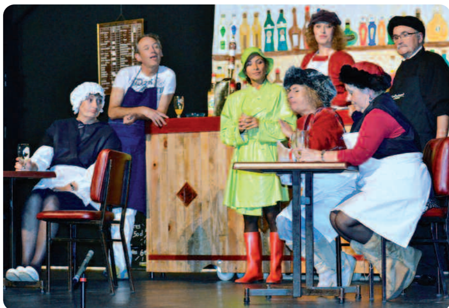
Une semaine de Brèves de comptoir de J.M. Gourio et J.M Ribes par la Compagnie Cube.