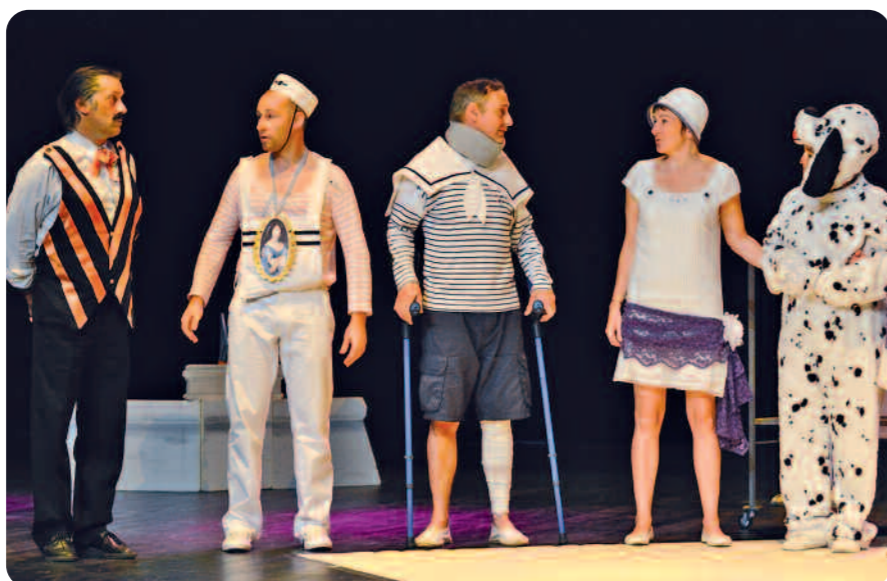
Central Park West de W. Allen par le Théâtre du Caboulot.