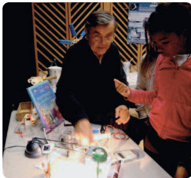
Les enfants découvrent la voiture fonctionnant avec une pile à combustible.