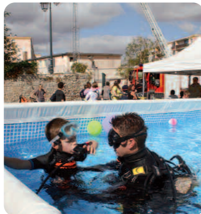
Baptême de plongée.

Les sapeurs pompiers de Ballancourt tiennent à remercier le conseil municipal, les services administratifs et techniques de la mairie pour l'aide apportée à la bonne organisation de leur manifestation.