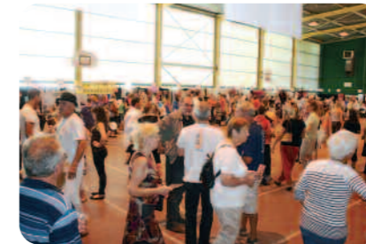
Un public nombreux.

D imanche 16 septembre, les Ballancourtois ont répondu présent au gymnase de Ballancourt à l'appel des associations. A noter cette année la naissance de trois nouvelles activités : la zumba avec l'association Z'ing, la danse moderne avec Krisaor et les claquettes avec Clac'Danse qui sont venues renforcer le tissu associatif local.