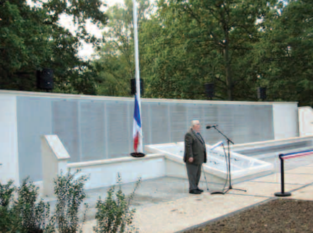
Un mémorial dédié à la mémoire des militaires.