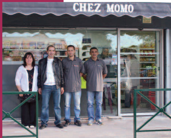
Une supérette au Turelle