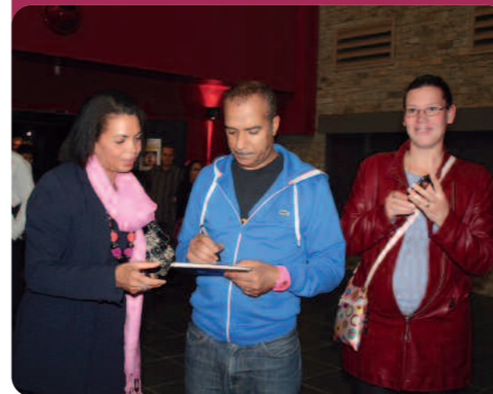
Séance d'autographes et pose photo.