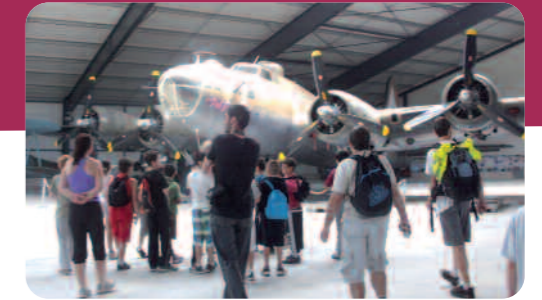
Visite du musée Salis à Cerny.

Petite pause, pour attendre les retardataires.