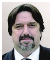
Michel POUZOL Député

En 2015 et 2016, le sénateur de l'Essonne a accompagné les projets de la ville : d'abord en finançant la moitié des panneaux pédagogiques du château (10 000 €) et en soutenant l'équipement des écoles en outils numériques (10 000 €).