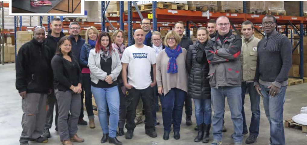
L'équipe du site dourdanais de l'entreprise Derrière la porte

Installée depuis 10 ans à Dourdan, l'entreprise crée des objets de décoration intérieure gais et originaux.