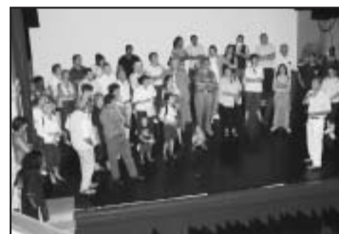
Ces journées du Patrimoine furent aussi l'occasion d'accueillir de nombreux nouveaux arrivants, une tradition bien étampoise et appréciée !