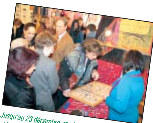
Jusqu'au 23 décembre, rendez-vous au salon Création et Métiers d'Art, à l'Hôtel Anne-de-Pisseleu, qui ouvrira ses portes samedi dernier et que l'on vernissait dimanche matin. Avis aux retardataires: des idées cadeaux originales de dernière minute vous y tendent les bras.