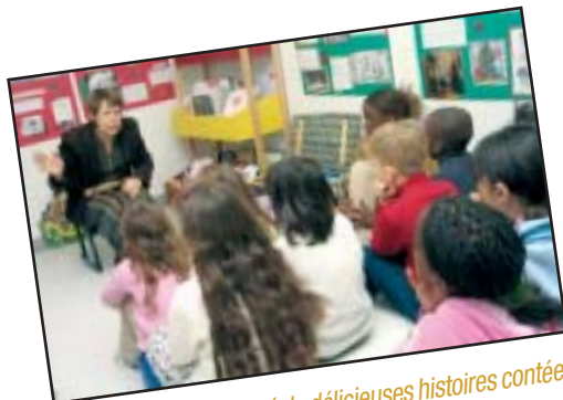
Les enfants ont savouré de délicieuses histoires contées à la bibliothèque Ulysse.