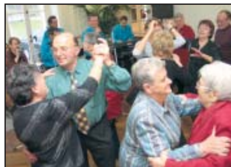
Les Aînés du Temps des Loisirs ont joyeusement fêté Noël au château de Valnay.

Cadeaux artisanaux et produits authentiques, barbe à papa et petit train, photos avec le Père Noël et peluches géantes, des centaines de visiteurs se sont rendus au village de Noël pour profiter des attractions et faire leur marché pour les fêtes.