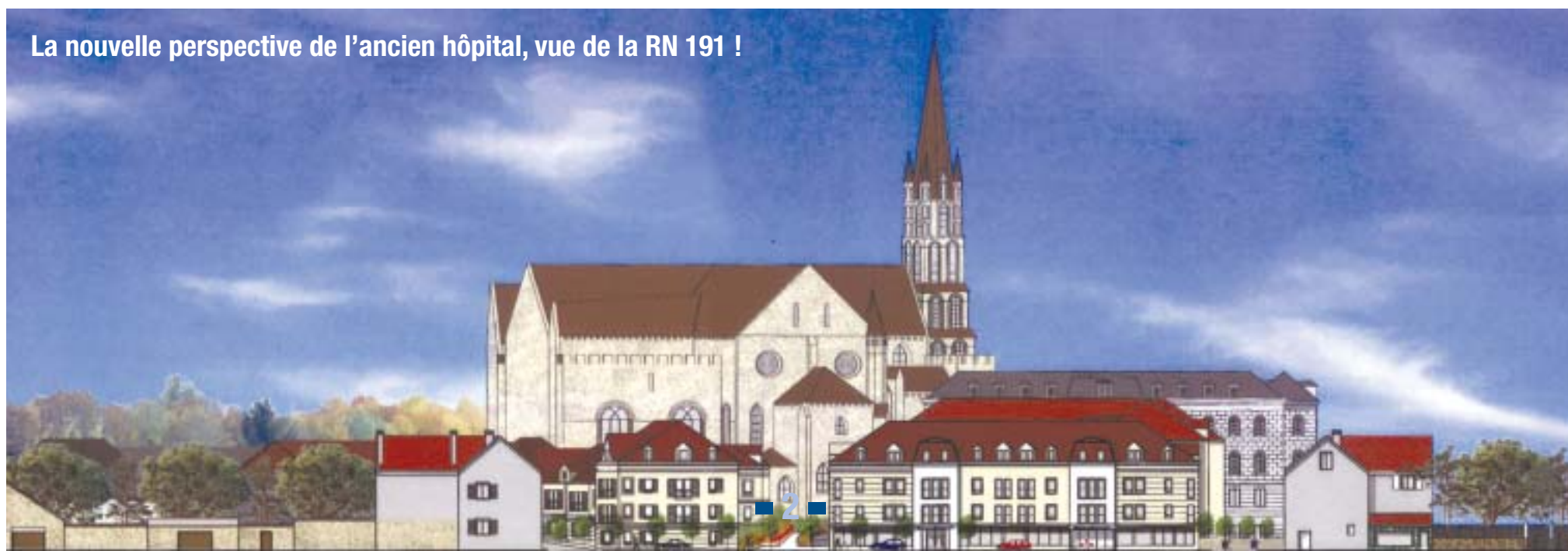
La nouvelle perspective de l'ancien hôpital, vue de la RN 191 !