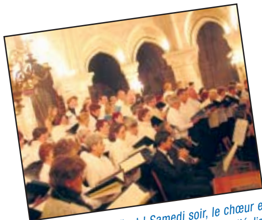
Magnifique Magnificat! Samedi soir, le chœur et l'orchestre du pays d'Etampes remplissaient l'église Saint-Martin avec trois œuvres de Bach interprétées magistralement.