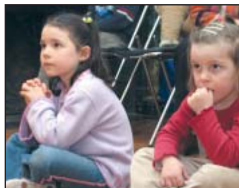
Le Groupement d'Animation de la Tour Penchée avait aussi invité un magicien, samedi à Valnay. Les enfants, jusqu'à 6 ans, à qui cette journée était dédiée, étaient suspendus du regard à chacun de ses gestes.