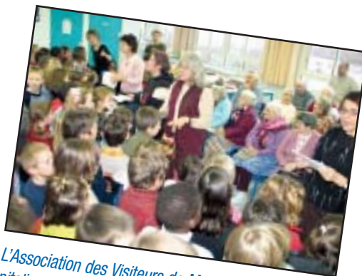
L'Association des Visiteurs de Malades en Milieu Hospitalier a conduit les résidents de la maison de retraite du Petit-Saint-Mars à l'école Louis-Moreau, pour un après-midi de chants et de bonne humeur partagée.