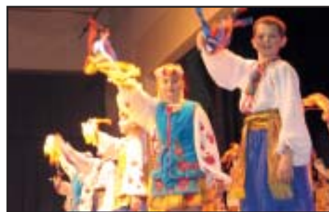
Plus de 600 Aînés sont venus assister au spectacle "Les Joyeux Petits Souliers d'Ukraine" proposé par la Ville.