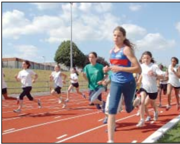
Et encore plein de belles performances réalisés par tous les autres clubs !