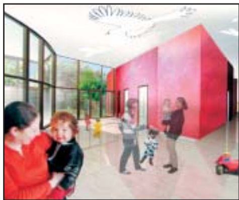
Le projet pour la Maison de la petite enfance a été choisi !

2004 aura été marquée par de nombreuses réalisations et par la mise en œuvre de multiples projets pour rénover les équipements, doter la commune de nouvelles installations, d'espaces verts, de parkings, pour améliorer les services rendus aux Etampois, réhabiliter le patrimoine historique ou bâti. En un mot pour que les Etampois se sentent bien dans leur ville, en toute tranquillité. Petit tour d'horizon.