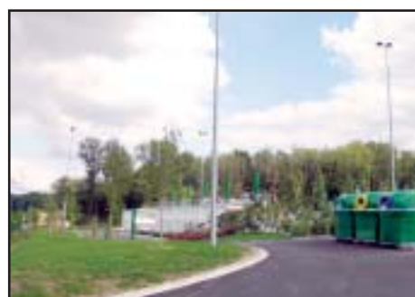
Protection de l'environnement. Etampes se dote d'une déchèterie.