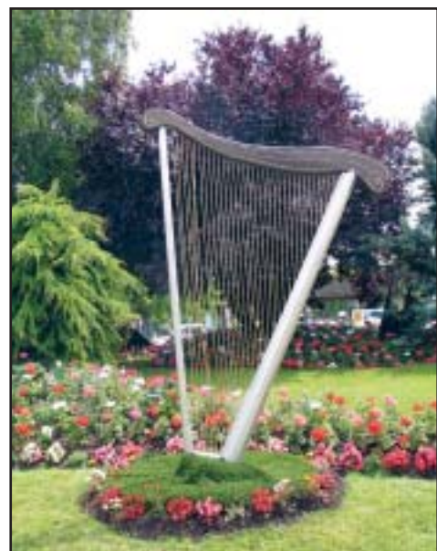
En janvier, la Ville d'Etampes obtenait un prix d'honneur au concours de fleurissement départemental . Un prix justifié. Etampes, ville verte et fleurie.