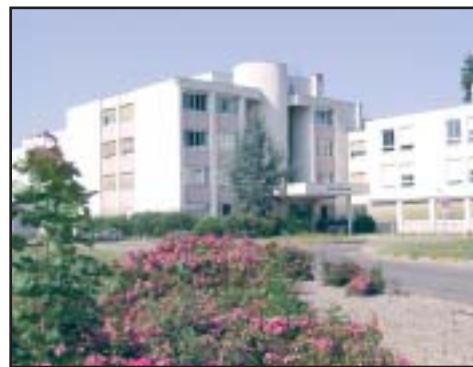
L'Hôpital d'Etampes reçoit l'autorisation pour avoir une IRM. Et se voit octroyer une subvention de 5 millions d'euros . Pour un pôle de santé pérenne et exemplaire.