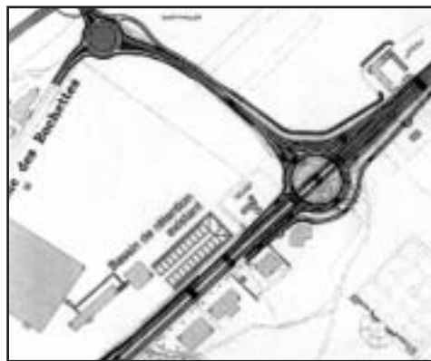
Le désenclavement de la zone industrielle a été déclaré projet d'utilité publique.