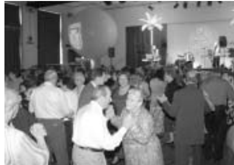
Une décoration de fête pour un après-midi des plus dansants.