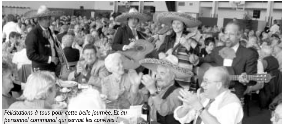
Félicitations à tous pour cette belle journée. Et au personnel communal qui servait les convives !