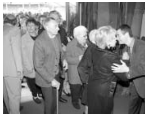
Nos Aînés accueillis en personne par les élus !