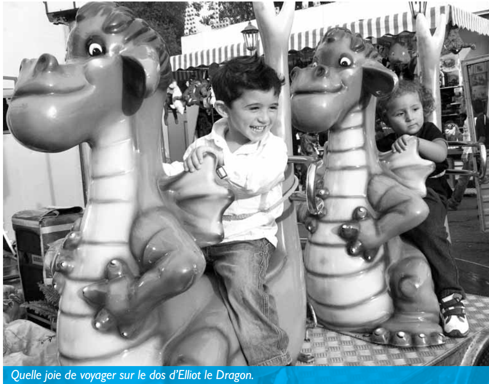
Quelle joie de voyager sur le dos d'Elliot le Dragon.