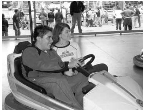
Quand on est élus, on aime aussi les manèges, la preuve !