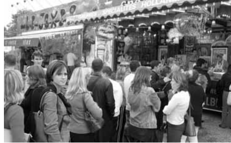
Côté gourmandise, il y avait aussi beaucoup de monde !