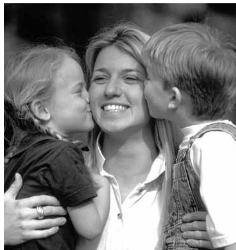
Ville, Notre-Dame, Ancienne-Comédie et du Petit-Marché.

Pour le bon déroulement de la manifestation, la circulation et le stationnement seront interdits sur les rues Sainte-Croix, Aristide-Briand, Paul-Hugo et sur les places de l'Hôtel-de-