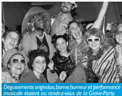
Déguisements originaux, bonne humeur et performance musicale étaient au rendez-vous de la Grave-Party.