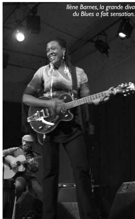
Ilène Barnes, la grande diva du Blues a fait sensation.