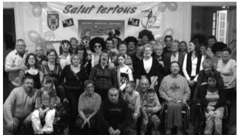
Hasard du calendrier, la soirée disco des Ch'tis de l'Essonne, organisée samedi 5 à Valnay, réunissait les thèmes des 2 grands succès actuels du cinéma français. Tous ont, pour l'occasion, sorti les perruques et les vestes à paillettes pour danser jusqu'au bout de la nuit !