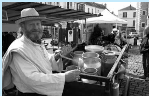
Placées sous le signe du "bio" les Printanières étaient l'occasion de déguster un bon verre de lait !