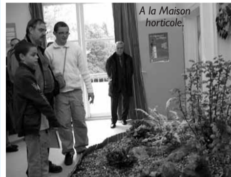
A la Maison horticole.