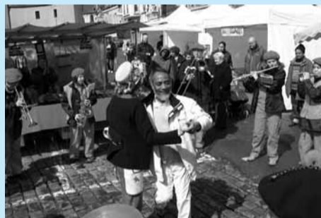
La pluie n'aura pas découragé les plus téméraires... Musique, danse et convivialité étaient de rigueur.