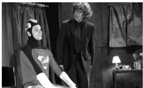
Que de rires pour le spectacle jeune public Monsieur Grogneux et l'automate , samedi 5 à l'Espace Jean-Carmet. Humour, chansons et bonne humeur ont su séduire le jeune public !