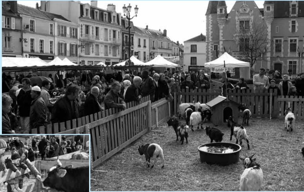
Pour le plus grand plaisir des enfants, des vaches et des chèvres avaient, pour la journée, élu domicile en Centre-Ville.