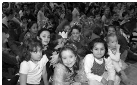
Vendredi 4 avril, les enfants de la crèche familiale, de la halte-garderie d'Etampes et du multi-accueil de Morigny-Champigny ont fêté carnaval à la salle des fêtes. L'équipe des 3 services intercommunaux avait préparé un superbe tour de chant. Les petits et les grands étaient aux anges !