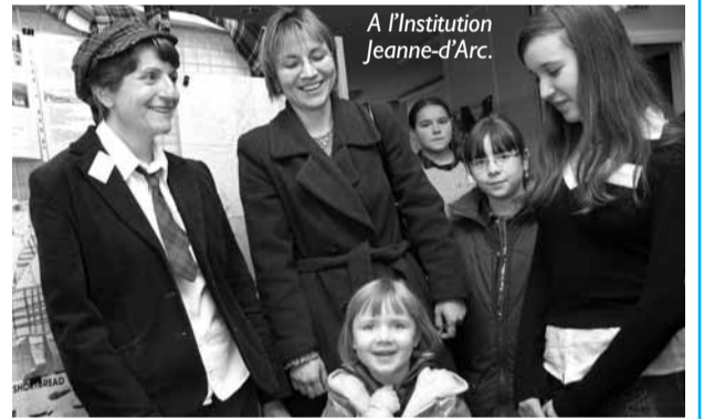
A l'Institution Jeanne-d'Arc.

Samedi 5, trois établissements ouvraient leurs portes au public afin de présenter leurs cursus. Le monde de l'hôtellerie et de la restauration au Moulin de la Planche, les productions forales et légumières à la Maison horticole et les différents enseignements de l'Institution Jeanne-d'Arc. Plus qu'instructif pour les enfants et les parents.