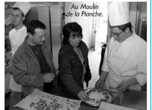
Au Moulin de la Planche.