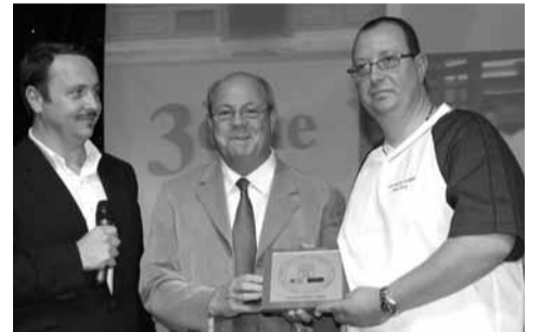
La pâtisserie Aux Délices d'Etampes a remporté le 3 e prix de sa catégorie. Un prix qui fait suite au 1 er prix remporté en 2000.