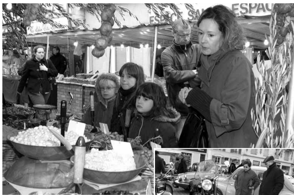
C'est en famille que les visiteurs sont allés déguster et acheter des spécialités culinaires de toutes les régions de France et se sont émerveillés devant les anciennes voitures et motos, place de l'Hôtel-de-Ville.

C'est parti. Les Automnales ont donné le coup d'envoi d'un mois de festivités commerciales. Décorations, illuminations, animations et bonne humeur seront le quotidien des Etampois jusqu'à la fin de l'année. Prochain rendez-vous, le village de Noël du 5 au 7 décembre, et n'oubliez pas vos commerçants qui sont à votre disposition tous les jours pour des idées-cadeaux !