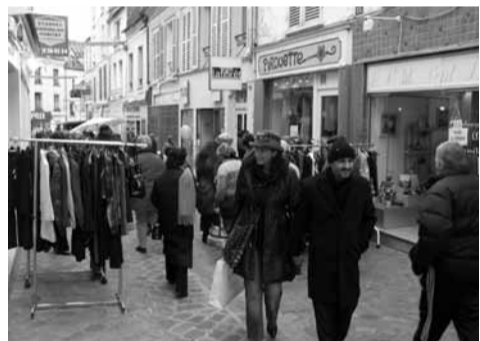
Les commerçants du Centre-Ville ont joué le jeu en étant ouverts tout le dimanche ! Sympa.