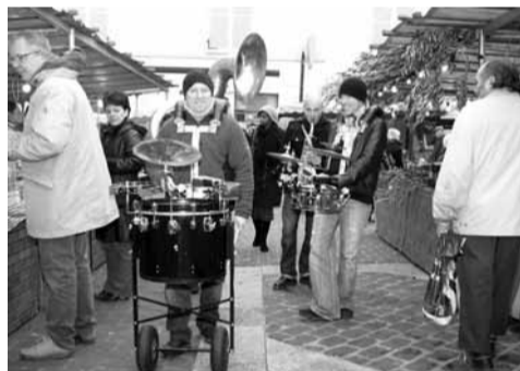
Les musiciens présents dans les allées ont amené un peu de soleil dans le cœur des visiteurs et des exposants.