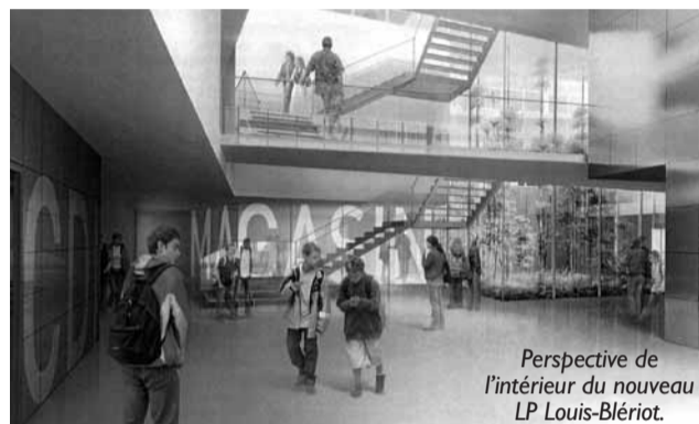
Perspective de l'intérieur du nouveau LP Louis-Blériot.

À la rentrée 2009, l'école maternelle Marie-Curie aura un nouveau visage avec une salle de restaurant qui évitera aux enfants de prendre le car pour déjeuner à l'école Louis-Moreau, une salle supplémentaire et une cour rénovée avec de nouveaux jeux (coût de l'opération 880 000 €). Les appels d'offre pour la construction du nouveau Lycée Professionnel Louis-Blériot vont être lancés et les travaux pourraient bien débiter avant la fin de l'année !