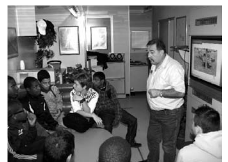
Le 17 décembre, avec des camions équipés de simulateurs de conduite ou encore de support vidéo, l'association les Pros de la Route participera à une journée de sensibilisation au lycée Louis-Blériot.