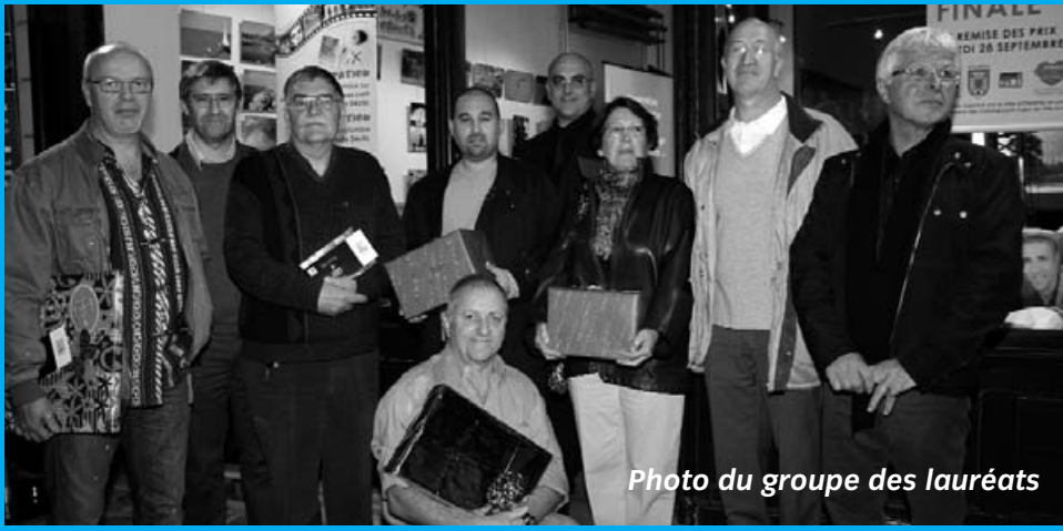
Photo du groupe des lauréats