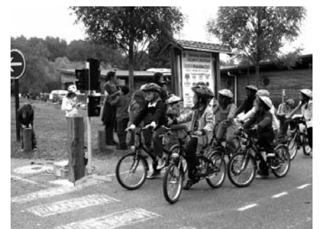
Sur la base de loisirs les 7 et 8 octobre, les élèves de CM1 vont participer à un parcours vélo. Il mettra à l'épreuve les acquis des enfants sur les règles de la circulation.