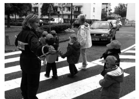
Le 4 octobre, les élèves de maternelle seront invités à participer à un rallye en Centre-Ville pour se familiariser aux règles de circulation des piétons.