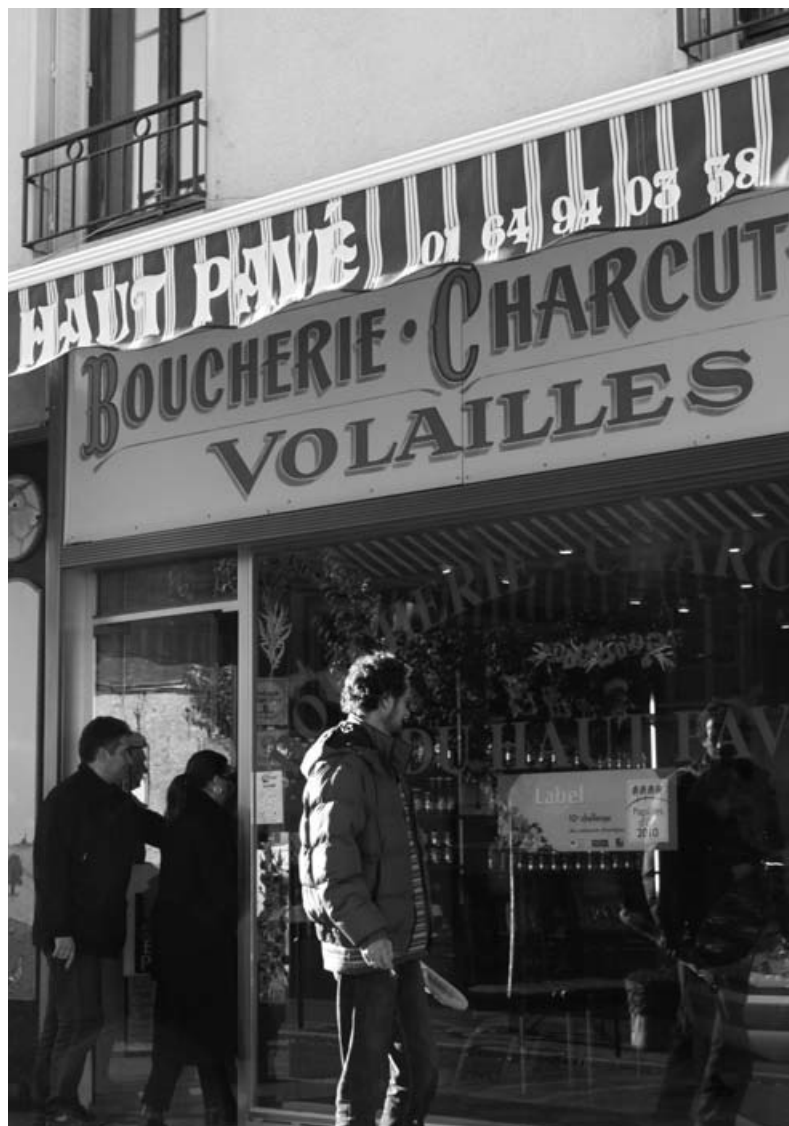
Boucherie du Haut-Pavé, lauréat du 3 e prix des Papilles d'Or 2011