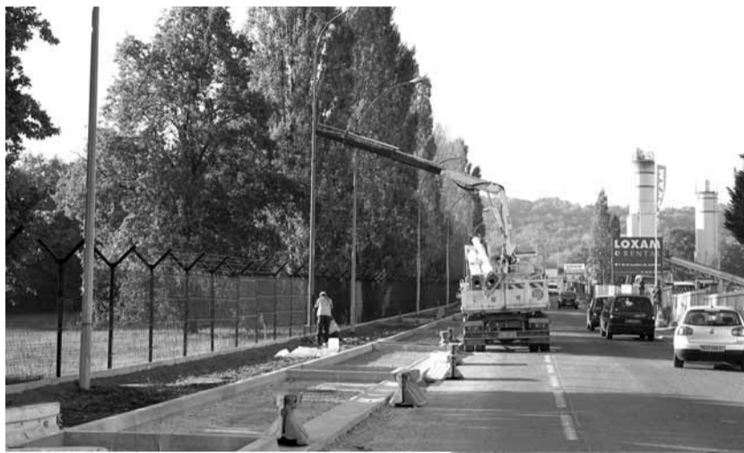
L'avenue de la Sablière a une nouvelle allure.

Au printemps, le pont-rail était installé. A l'automne c'était au tour des travaux de l'avenue de la Sablière de débuter. Plus aucun doute, le projet de désenclavement du parc Sudessor avance. Tour d'horizon de cette opération en 4 points !