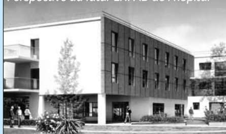
Perspective du futur EHPAD de l'hôpital

De nouveaux équipements de soins et d'accueil sanitaire en construction. Panorama complet.