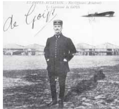
Carte postale d'époque issue des archives municipales d'Etampes.

26 décembre 1914 : Triste Noël. Près de 5 mois de guerre se sont écoulés. Les temps sont difficiles. Moins du fait de la pénurie que de la vie chère. Le charbon se fait rare. Une