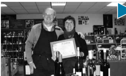
Intercave et la boucherie Notre-Dame parmi les lauréats 2014 de l'opération de la Chambre de Commerce et d'Industrie.

→ Les enseignes ont fleuri dans la Cité royale : bar à tapas « Chez Yo », bar-brasserie « Stendhal », restaurant « Saveur du Sénégal », « Elodie Mercerie », institut de beauté « Thalia », boutique de chaussure « L'art de la Mode », traiteur « L'Olivier », magasin de vêtements « No Limit », centre de contrôle technique avec « Autocontrol », épicerie « Le Panier Sympa », spa, beauté et remise en forme avec « Sourire et Séduction », « Matériel Médical Notre-