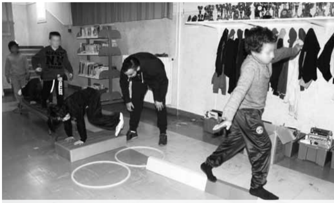
Educateur sportif, un métier au contact des jeunes.

Ces derniers mois, le nombre de jeunes signant un contrat d'avenir s'est multiplié. « Alors que la Mission locale a pris en charge le dispositif en novembre 2012, ce dernier est véritablement monté en puissance en milieu d'année 2013. Fin juin, 29 jeunes avaient été recrutés. Fin octobre, ils étaient 48. Et aujourd'hui, 62 jeunes suivis par la Mission locale sont en poste dont 5 dans le secteur marchand. Les 2 derniers contrats signés sont tout récents. Et pourtant le territoire