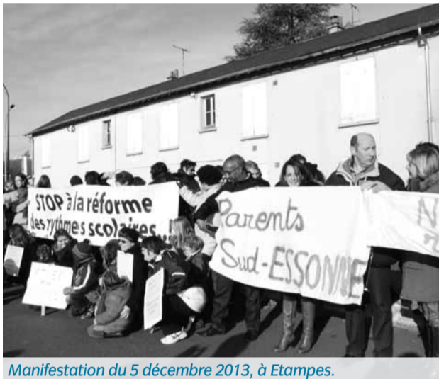
Manifestation du 5 décembre 2013, à Etampes.