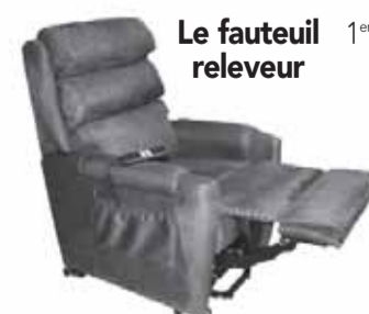
Le fauteuil releveur

1 er cadeau offert par les enfants à leurs parents, un fauteuil de grand confort.