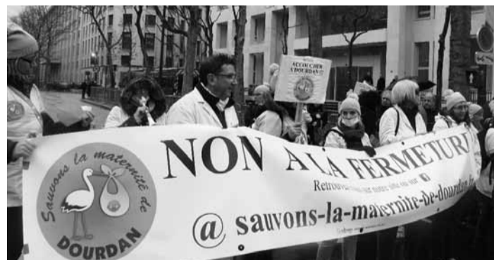
Manifestation organisée à Paris, le 9 janvier, devant le ministère de la Santé.

Depuis le 21 octobre dernier, cette autorité avait interdit