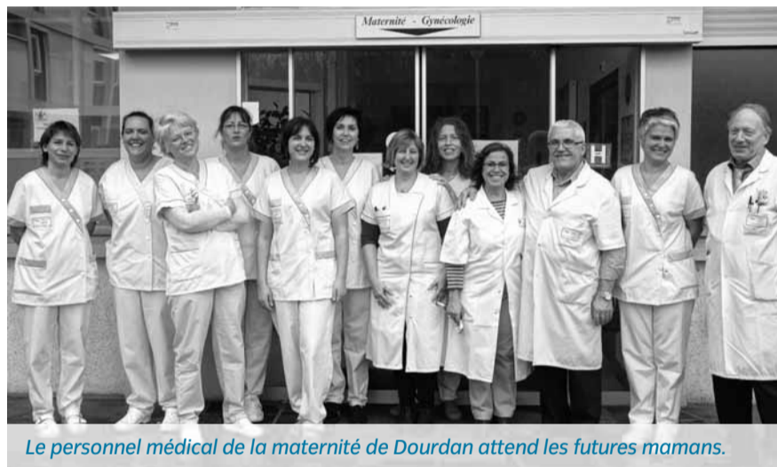
Le personnel médical de la maternité de Dourdan attend les futures mamans.

tout accouchement à la maternité de Dourdan après le décès d'un nouveau né survenu en juillet 2013. « Le CHSE avait alors orienté l'ensemble des patientes, en fonction de leur choix, vers les maternités environnantes. Ainsi, depuis la fin octobre, 58 patientes ont pu accoucher à la maternité d'Etampes dans de bonnes conditions d'accueil », rappelle Thomas Talec. Pendant la période de suspension de l'activité obstétricale de la maternité de Dourdan, la solidarité entre les 2 sites du CHSE a joué à plein. « La majorité des femmes enceintes dont l'accouchement était programmé à la maternité de Dourdan ont choisi d'accoucher à celle d'Etampes. Elles ont été accueillies par les équipes soignantes d'Etampes, renforcées par une partie de l'équipe dourdanaise. L'autre partie restant à Dourdan pour y assurer les consultations et les avis en urgence », explique le Dr Hafid Lamrani, responsable