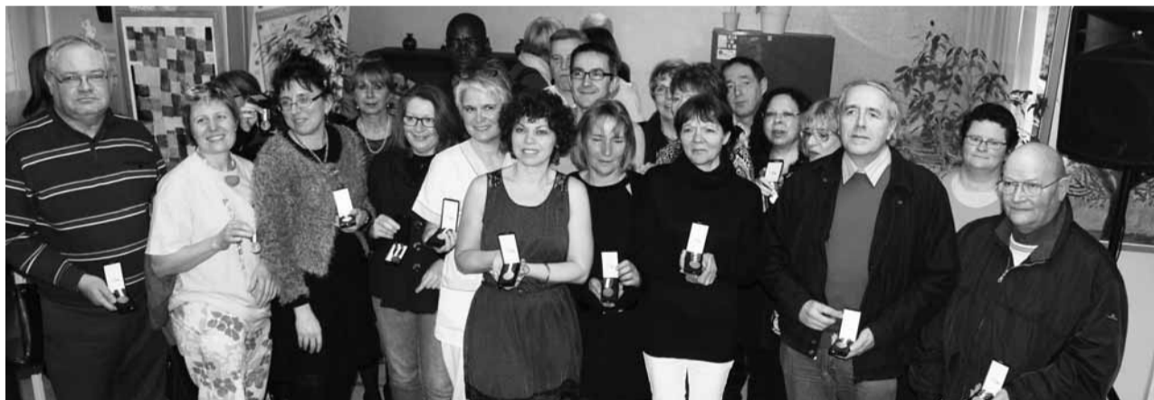
54 agents du CHSE ont été récompensés d'une médaille du travail. 26 ont reçu celle d'argent (20 ans au sein de la fonction publique hospitalière), 21 de vermeil (30 ans) et 7 d'or (35 ans).

→ Cancérologie : une offre de soins renforcée sur les 2 sites. Le CHSE renforce la cancérologie à Dourdan et Etampes avec pour objectif de baisser les délais de prise de rendez-vous. « Un cancérologue réalise des consultations sur les 2 sites. La nouveauté, c'est que désormais tout peut se faire à Etampes mais aussi à Dourdan : consultations spécialisées, bilans, diagnostics et séances de chimiothérapie. Le traitement par chimiothérapie se fait sur un certain nombre de séances. D'où l'importance de pouvoir les effectuer à proximité des lieux de vie. »