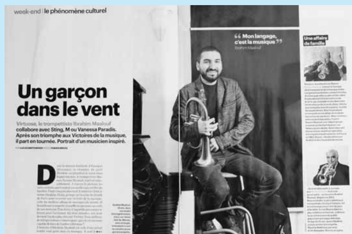
« Le Parisien magazine » du 4 avril.

D'ici là, retrouvez l'essentiel de l'actualité locale sur : www.mairie-etampes.fr