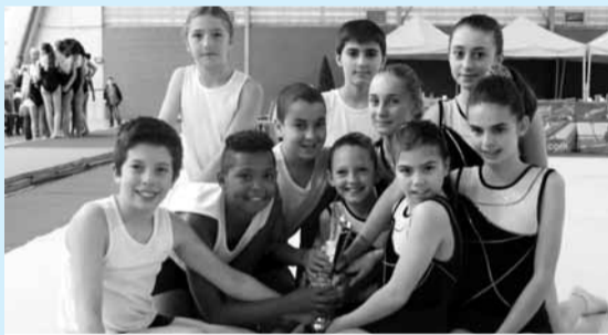
L'équipe débutante mixte remportant le titre Île-de-France en team-gym.

LE WEEK-END DES 5 ET 6 AVRIL, les poussines en gymnastique artistique ont débuté leur championnat départemental à Épinay-sous-Sénart. L'équipe arrive 7 e et se hisse en finale régionale. Le groupe fédéral junior en gymnastique aérobic était quant à lui à Châlons-en-Champagne (Marne) pour la 1/2 finale nord et s'est qualifié pour le championnat de France