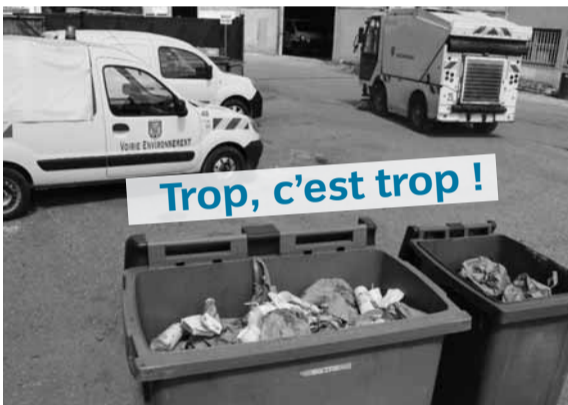
100 kg de déchets de fast-food ramassés chaque semaine par les agents municipaux !

Ce samedi se déroulera l'opération départementale Essonne-Verte, Essonne-Propre. L'occasion pour Etampes info d'aborder la problématique du comportement de certains consommateurs de fast-food. Chaque semaine, la ville ramasse une quantité incroyable de déchets provenant de ces enseignes de restauration rapide. Non seulement ces gestes d'incivilité sont inadmissibles pour l'environnement, mais ils ont aussi un coût pour la commune et chaque Etampois. Ça ne peut plus durer ! Il faut que ça change.