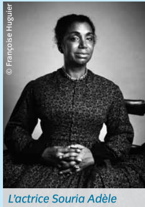
L'actrice Souria Adèle