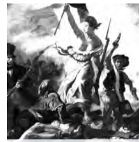
« La Liberté guidant le peuple », E. Delacroix.