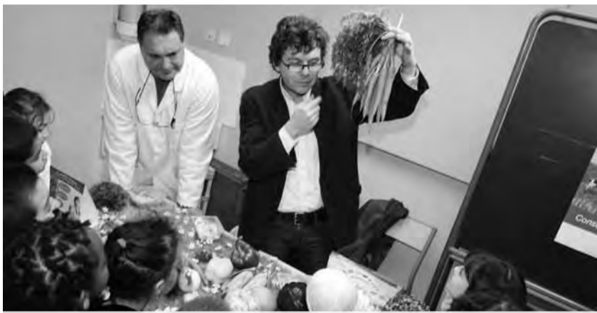
Dans les écoles d'Etampes, une fois par mois, on mange bio !

Manger local, c'est idéal. Pourquoi ? Car c'est permettre de retrouver et de faire apprécier le goût des produits de saison, de mieux connaître l'origine des aliments, de partager un moment d'échange avec les producteurs et transformateurs et découvrir leur quotidien et leurs savoir-faire, de participer au maintien et au développement d'une économie locale dynamique, d'assurer des débouchés plus stables aux producteurs locaux. Convaincue de cet enjeu, la Ville a établi des partenariats avec plusieurs producteurs locaux. Et ce n'est pas fini. Elle entend développer ce service de qualité, utile à tous.