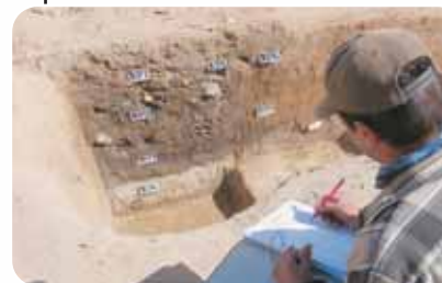
Enregistrement et description des couches archéologiques