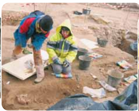
Fouille d'une sépulture