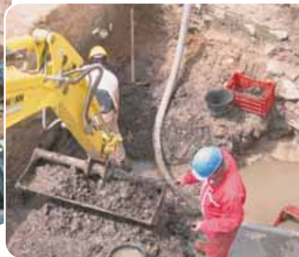
Fouille d'un bassin médiéval