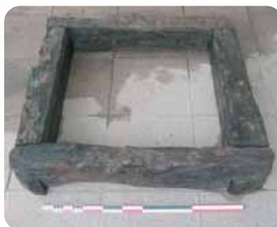
Cadre en chêne soutenant les parois d'un puits