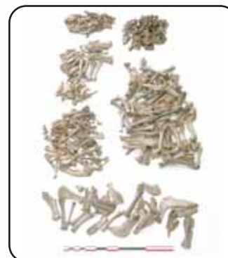
Ensemble de restes d'animaux rejetés dans un bassin (XII e siècle)