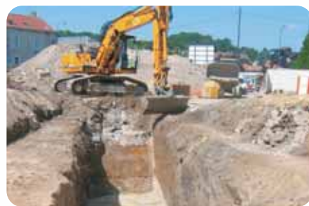
Décapage à la pelle mécanique

Aujourd'hui, la phase d'étude est en cours. Elle est menée par deux archéologues ayant participé à la fouille sur le terrain, associés à différents spécialistes : anthropologue (7 mois d'étude pour les sépultures), céramologue (6 mois d'étude pour les poteries), xylogue (4 mois d'étude pour les bois), archéozoologue (4 mois d'étude pour les restes animaux), carpologue (3 mois d'étude pour les graines, pépins et autres restes végétaux) pour les principaux contributeurs. Certaines catégories de mobilier sont moins bien représentées : la verrerie, les restes de cuir, les monnaies (à peine une quinzaine de monnaies médiévales)... Les études spécialisées terminées, toutes ces informations donneront lieu à la rédaction d'un rapport final d'opération (prévu pour la fin de l'année 2007).