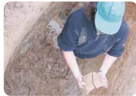
Découverte d'un mortier en pierre