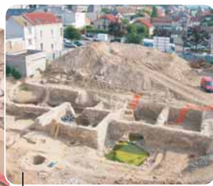
Vue d'ensemble d'un secteur de la fouille

L'opération archéologique comprend deux étapes : la phase de terrain et l'étude. La fouille sur le terrain s'est déroulée de mi-janvier à fin juillet 2006. L'équipe a été constituée en moyenne d'une dizaine de personnes.