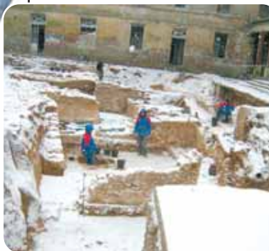
Le chantier sous la neige

Deux opérations de sondage, en 1995 et 2003, ont démontré l'existence de niveaux anciens. Le ministère de la Culture (Direction Régionale des Affaires Culturelles, Service Régional de l'Archéologie) a donc prescrit une opération de fouille, qui a été confiée à l'INRAP (Institut National de Recherches Archéologiques Préventives).