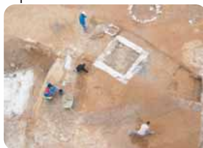
Nettoyage manuel pour faire apparaître les structures médiévales