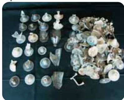
Ensemble de verreries du XVI e siècle

Aujourd'hui, la phase d'étude est en cours. Elle est menée par deux archéologues ayant participé à la fouille sur le terrain, associés à différents spécialistes : anthropologue (7 mois d'étude pour les sépultures), céramologue (6 mois d'étude pour les poteries), xylogue (4 mois d'étude pour les bois), archéozoologue (4 mois d'étude pour les restes animaux), carpologue (3 mois d'étude pour les graines, pépins et autres restes végétaux) pour les principaux contributeurs. Certaines catégories de mobilier sont moins bien représentées : la verrerie, les restes de cuir, les monnaies (à peine une quinzaine de monnaies médiévales)... Les études spécialisées terminées, toutes ces informations donneront lieu à la rédaction d'un rapport final d'opération (prévu pour la fin de l'année 2007).